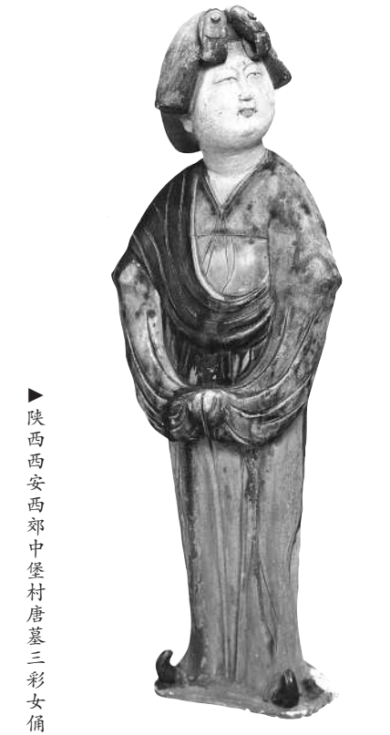
▶陕西西安西郊中堡村唐墓三彩女俑