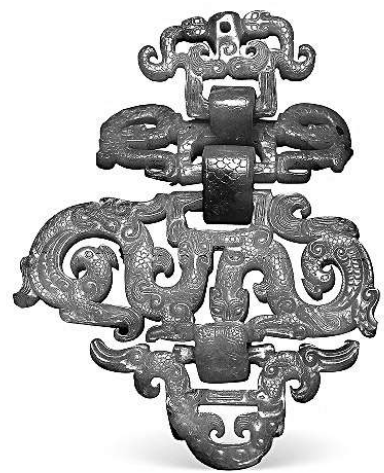
▶龙凤纹四节玉佩 1978年随县擂鼓墩曾侯乙墓出土 湖北省博物馆藏

湖北省博物馆收藏了一件战国龙凤纹四节玉佩，这件玉佩出土于曾侯乙墓，由一块玉料雕成，分可以活动卷折的4节。共雕刻出7条卷龙、4只凤鸟和4条蛇。是战国时期玉器雕刻水平和复杂工艺的典型代表之一。