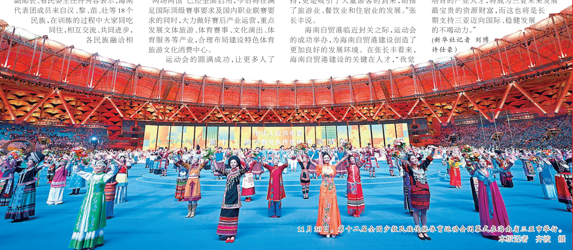
11月30日,第十二届全国少数民族传统体育运动会闭幕式在海南省三亚市举行。