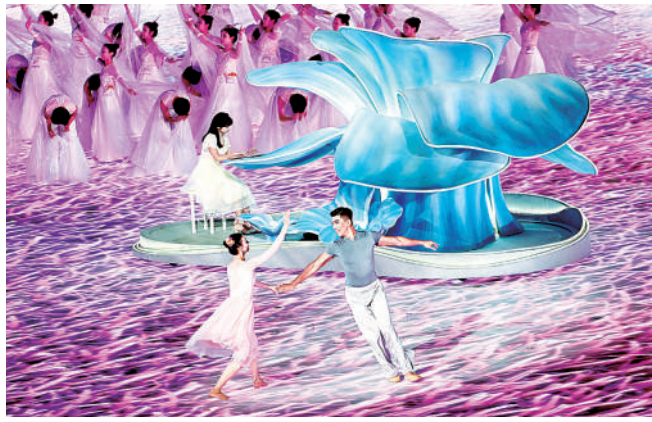
图为运动会闭幕式上的钢琴独奏和舞蹈表演。

海南各民族运动员欢聚一堂,在共享欢乐的氛围中缔结了民族友谊。海南代表团副团长、海南省委统战部副部长、省民委主任符秀容表示,海南代表团成员来自汉、黎、苗、壮等18个民族,在训练的过程中大家同吃同住,相互交流、共同进步,各民族融洽相