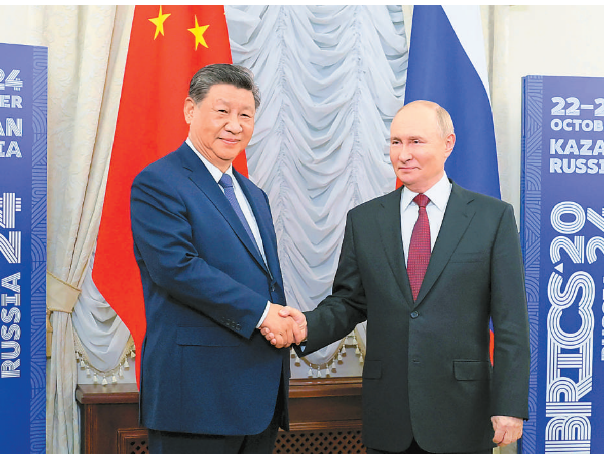
当地时间十月二十二日下午，国家主席习近平在喀山克里姆林宫同俄罗斯总统普京举行会晤。

新华社俄罗斯喀山10月22日电（记者 郝薇薇 黄河）当地时间10月22日下午，国家主席习近平在喀山克里姆林宫同俄罗斯总统普京举行会晤。 习近平指出，今年是中俄建交75周年。75年来，中俄关系风雨兼程，探索出“不结盟、不对抗、不针对第三方”的相邻大国正确相处之道。双方秉持永久睦邻友好、全面战略协作、互利合作共赢精神，不断深化和拓展全面战略协作和各领域务实合作，为推动两国发展振兴和现代化建设注入强劲动力，为增进中俄人民福祉、维护国际公平正义作出重要贡献。当前，世界正处于百年未有之大变局，国际形势变幻莫测，但中俄世代友好的深厚情谊不会变，济世为怀的大国担当不会变。尽管面临复杂严峻的外部形势，两国贸易等各领域合作积极推进，大型合作项目稳定运营。双方要继续推动共建“一带一路”倡议和欧亚经济联盟深入对接，