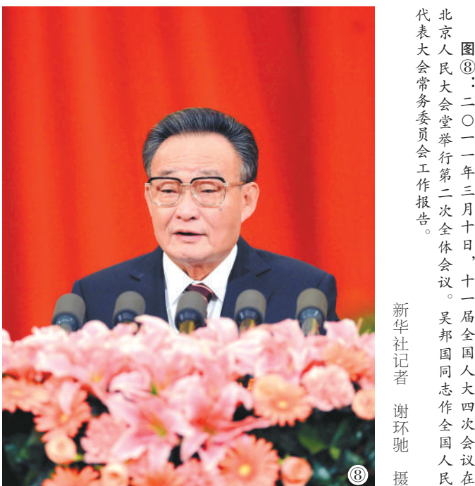
图⑧：二〇一一年三月十日，十一届全国人大四次会议在北京人民大会堂举行第二次全体会议。吴邦国同志作全国人民代表大会常务委员会工作报告。