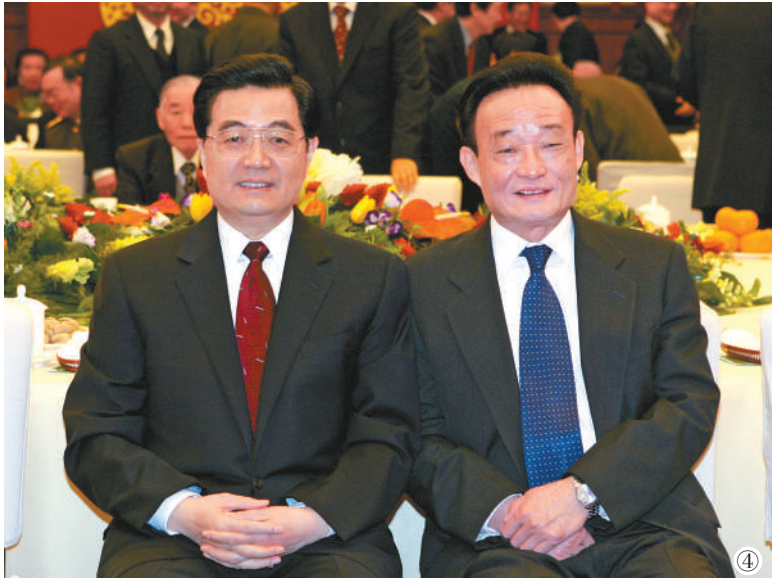
图④：二〇〇五年一月一日，全国政协在北京举行新年茶话会。这是胡锦涛同志与吴邦国同志在一起。