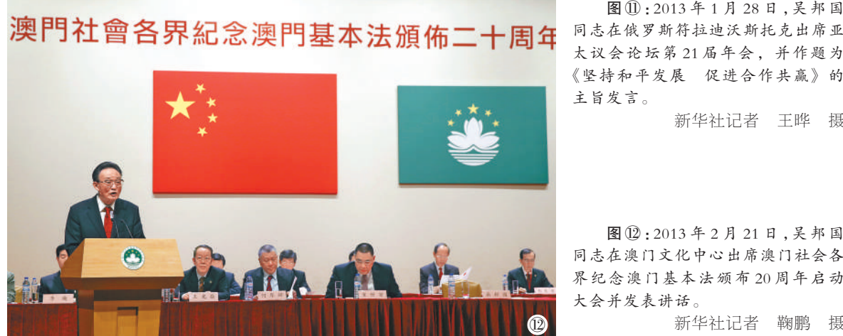
图⑫：2013年2月21日，吴邦国同志在澳门文化中心出席澳门社会各界纪念澳门基本法颁布20周年启动大会并发表讲话。