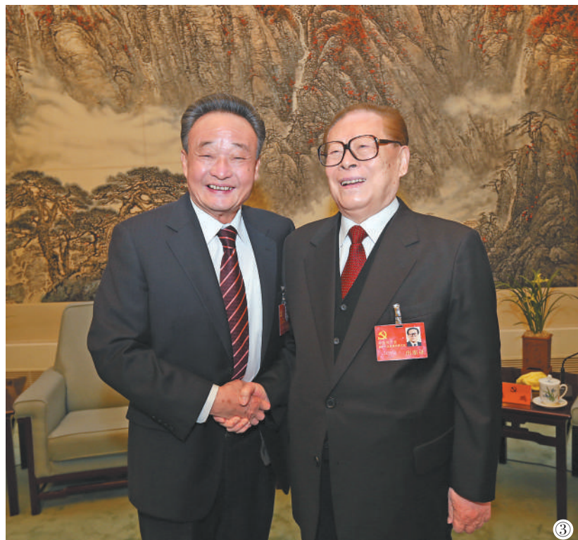
图③：2012年11月14日，中国共产党第十八次全国代表大会在北京闭幕。这是闭幕会前，江泽民同志与吴邦国同志在一起。