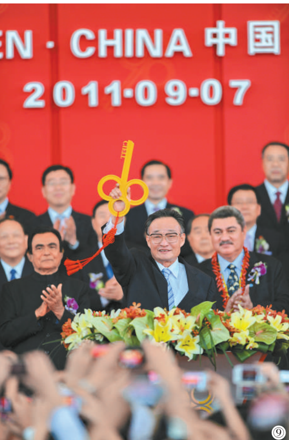
图⑨：二〇一一年九月七日，吴邦国同志在福建厦门出席第十五届中国国际投资贸易洽谈会开幕式。