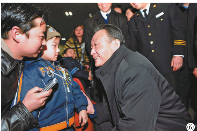
图⑥：2008年2月3日，吴邦国同志在北京西站候车室与旅客交谈。