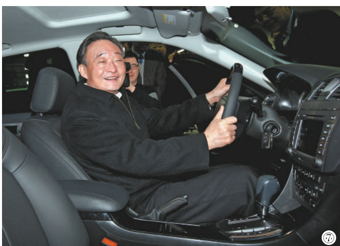
图⑦：2010年1月30日，吴邦国同志在上海汽车集团股份有限公司技术中心察看新能源汽车。