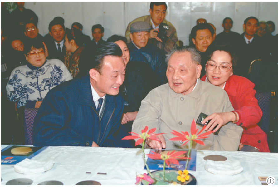
图①：1992年2月10日，邓小平同志在上海贝岭微电子制造有限公司参观时与吴邦国同志交谈。