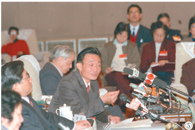
图⑤：1994年3月，时任上海市委书记的吴邦国同志在全国两会上海代表团全团会议上。

吴邦国同志是中国特色社会主义民主法治建设的重要领导者。他强调，如果没有比较完备的、高质量的法律体系，就谈不上实现社会主义民主政治的制度化、规范化和程序化，就谈不上依法治国、建设社会主义法治国家。在党中央领导下，他将立法工作作为全国人大及其常委会的首要任务，紧紧围绕党中央确定的立法工作目标，坚持科学立法、民主立法，适应社会主义市场经济发展、社会全面进步和加入世贸组织的新形势，把中国特色社会主义法律体系中基本的、急需的、条件成熟的法律作为立法重点，抓紧制定修改相关法律，集中开展法律清理工作。2003年3月，他担任中央宪法修改小组组长，在中央政治局常委会领导下主持宪法修改工作。由十届全国人大二次会议通过的宪法修正案，确立了“三个代表”重要思想在国家政治和社会生活中的指导地位，明确国家尊重和保障人权，依法保护公民的私有财产权和继承权等内容，对促进我国经济社会发展、推进中国特色社会主义民主法治建设具有重要意义。在他的主持下，第十届、十一届全国人大及其常委会共审议通过宪法修正案草案、法律草案、法律解释草案和有关法律问题的决定草案186件，包括物权法、企业破产法、企业所得税法、公务员法、行政许可法、治安管理处罚法、劳动合同法、未成年人保护法、妇女权益保障法、关于加强网络信息保护的决定等。在党中央领导下，他主持制定反分裂国家法，把党和国家对台工作的大政方针和政策措施以法律形式固定下来，为反对和遏制“台独”分裂活动、促进祖国和平统一提供有力法律保障。他主持对香港特别行政区基本法、澳门特别行政区基本法及其附件有关条款作出解释并通过相关决定，推动两个基本法正确实施和“一国两制”方针贯彻落实。（下转7版）