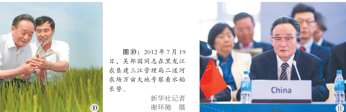
图⑪：2013年1月28日，吴邦国同志在俄罗斯符拉迪沃斯托克出席亚太议会论坛第21届年会，并作题为《坚持和平发展 促进合作共赢》的主旨发言。