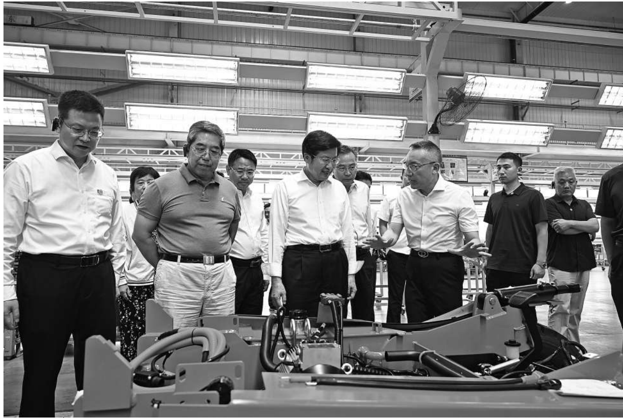
视察团在湖北中力机械有限公司生产车间了解企业科技创新新情况

如何更好优化民营企业发展环境？地方坚持和落实“两个毫不动摇”有哪些具体举措，有什么新鲜经验可以借鉴总结？带着这些问题，8月30日至9月2日，全国政协副主席、全国工商联主席高云龙率全国政协经济委员会“持续优化民营企业发展环境”专题视察团，在行走间寻找答案。