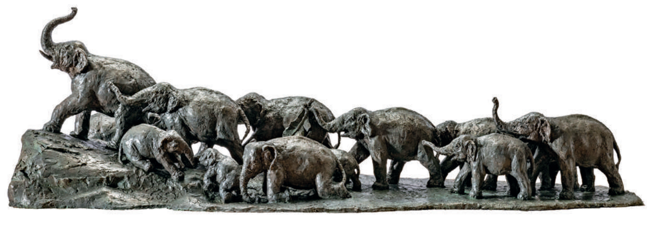
生物的长城脊 (雕塑)