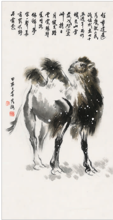
任重道远 (国画) 王为政 作