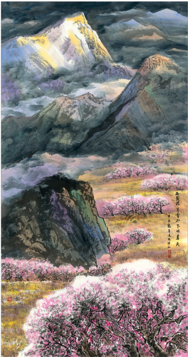
西藏林芝雪山下的春天 (国画) 尼玛泽仁 作