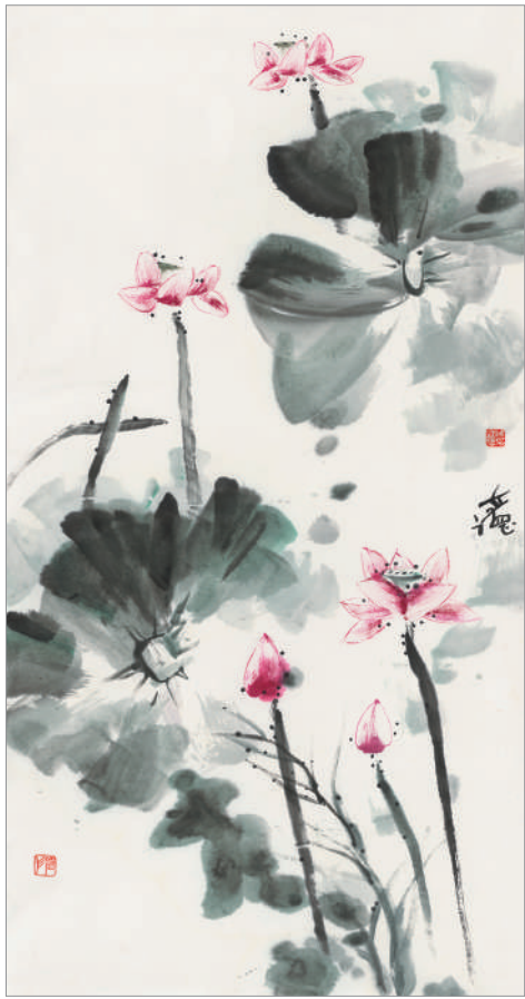
荷香悠远 (国画) 陈立德 作