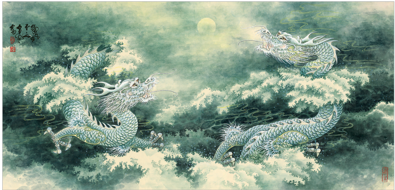
盛世乘龙 万里融通 (国画)