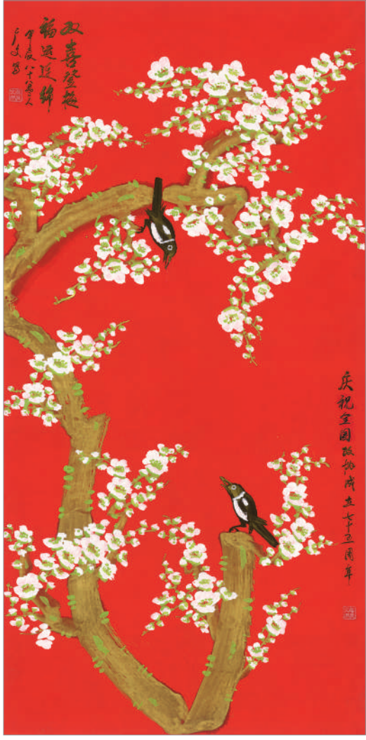
双喜登梅 福运连绵 (国画)

以人民为中心、以精品奉献人民、用明德引领风尚的工作方向，用创作记录新时代、书写新时代、讴歌新时代。在创作思想上，他们勇于回答时代课题，从当代中国的伟大创造中发现创作的主题、捕捉创新的灵感，深刻反映了新时代的历史巨变，描绘了新时代的精神图谱，为时代画像、为时代立传、为时代明德。全国政协委员美术家们坚持不懈用习近平新时代中国特色社会主义思想凝心铸魂，在赓续文脉中坚定自信，在彰显主流中体现担当，为建设中华民族现代文明、实现中华民族伟大复兴汇聚磅礴力量。