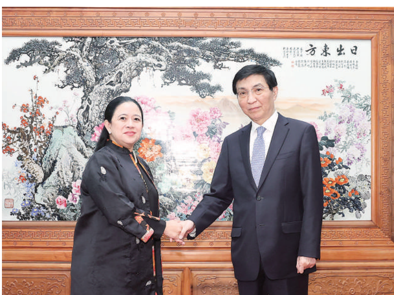
5月28日，全国政协主席王沪宁在北京会见印度尼西亚国会议长布安。

新华社北京5月28日电 全国政协主席王沪宁28日在京会见印度尼西亚国会议长布安。