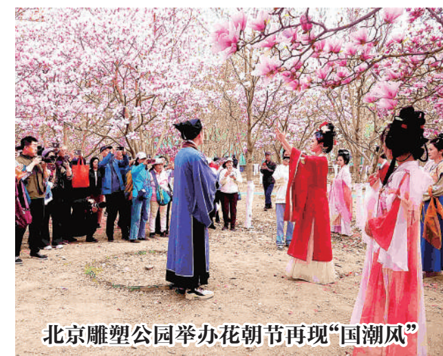
北京雕塑公园举办花朝节再现“国潮风”

近期，北京国际雕塑公园成了京西最热的“打卡”地之一。在这里举办的第21届玉兰赏花期暨首届北京·石景山花朝游园会上，市民们不仅能够欣赏到北京种类最齐全的玉兰花，还能穿越百年体验传统节日——花朝节。