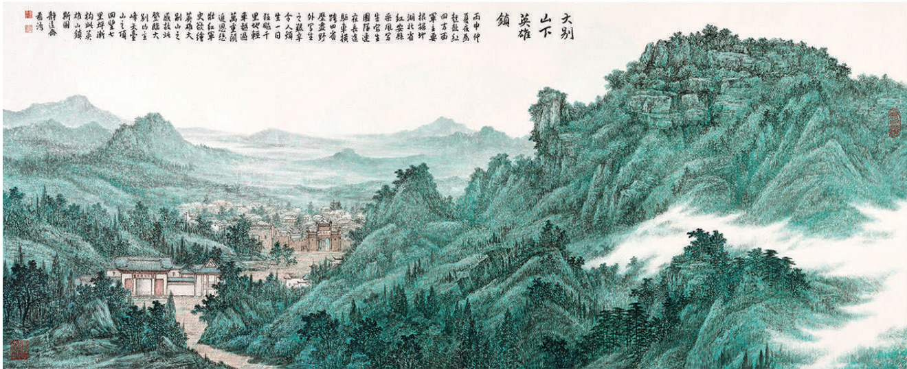
大别山下英雄镇 (国画)

全国政协委员中的美术工作者将坚持以人民为中心的创作导向，创作更多增强人民精神力量的优秀作品，肩负起时代赋予的责任和使命，与人民同心同行，共绘新时代壮丽图景。