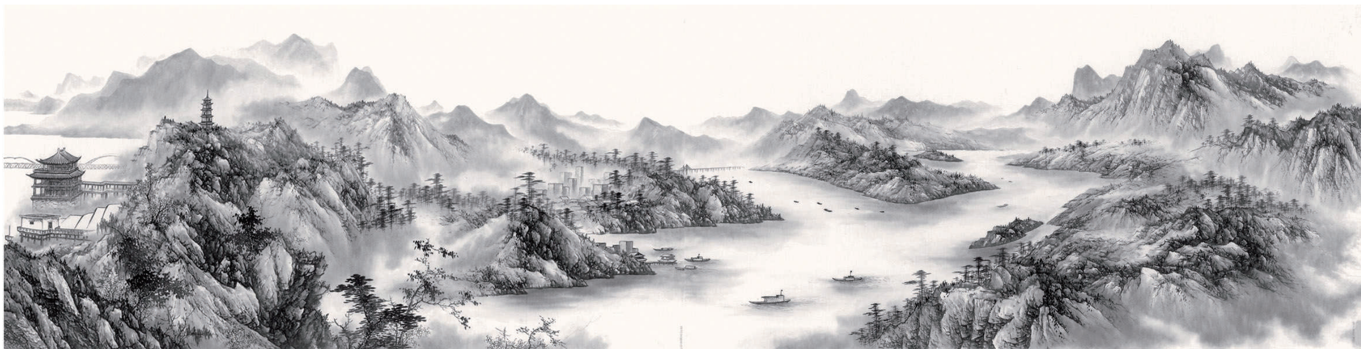
《长江万里图》之江西段 (国画)