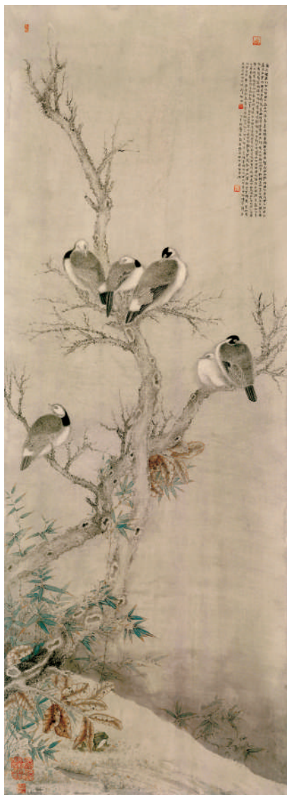
红叶微风 (国画) 刘万鸣 作