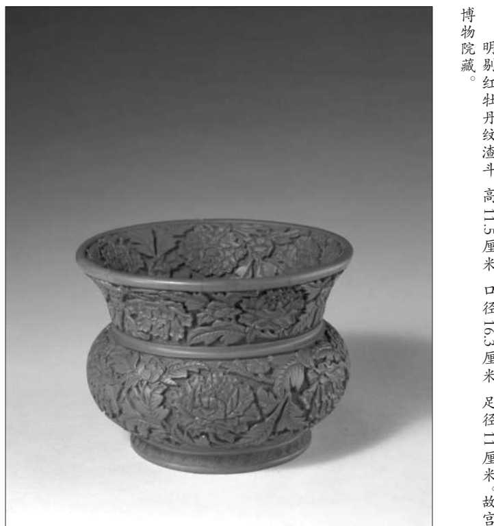
博物院藏。明剔红牡丹纹渣斗，高二5厘米，口径15.5厘米，足径二厘米。故宫

明剔红牡丹纹渣斗通体聚朱漆，在菱形格锦地上雕花卉纹，器腹、颈内外壁均雕俯仰相间的牡丹花和花蕾。