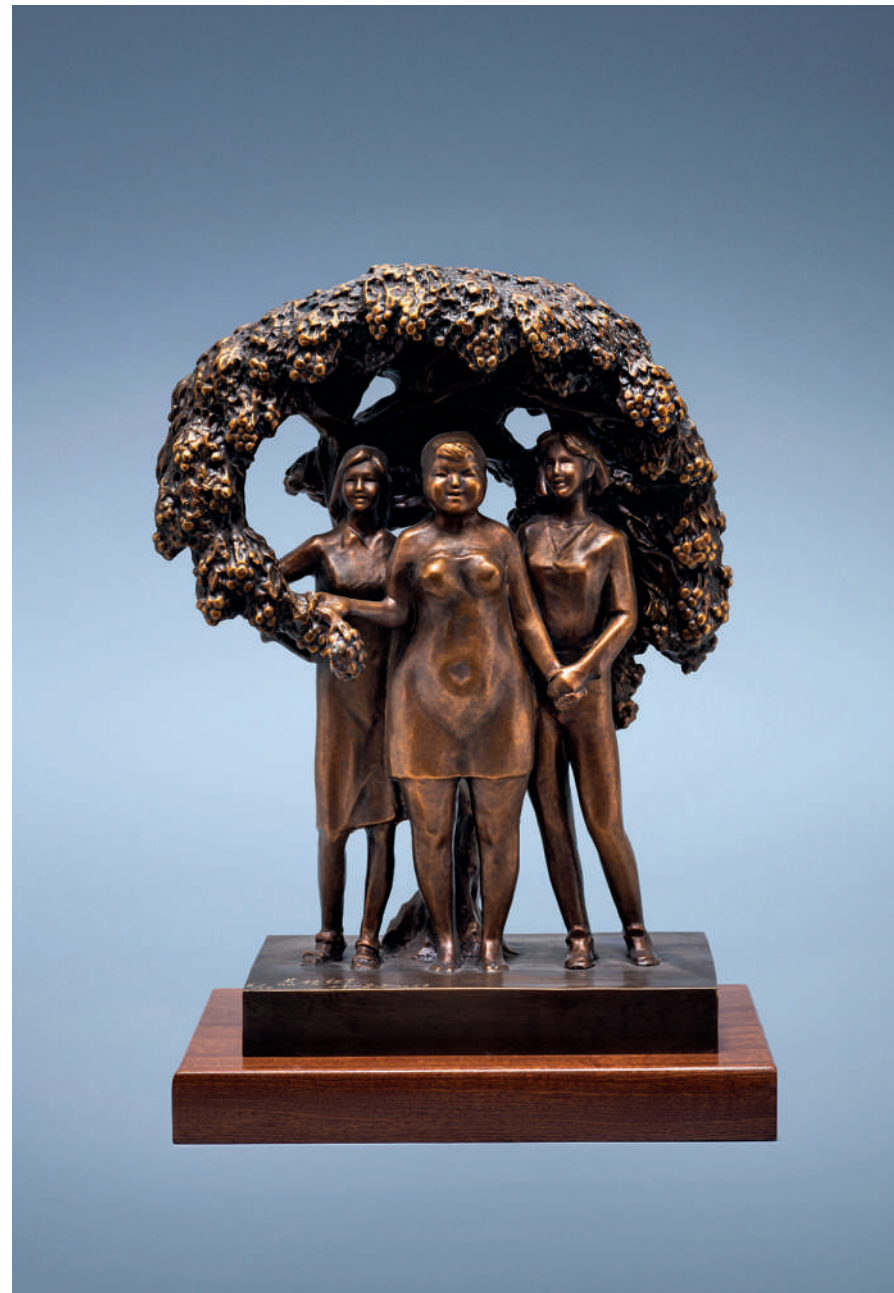
荔枝红了 (雕塑) 许鸿飞 作