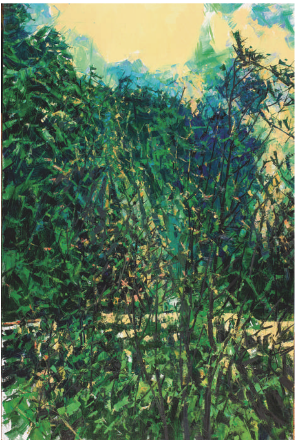
富春山旅图·山湾碧树 (油画) 许江 作