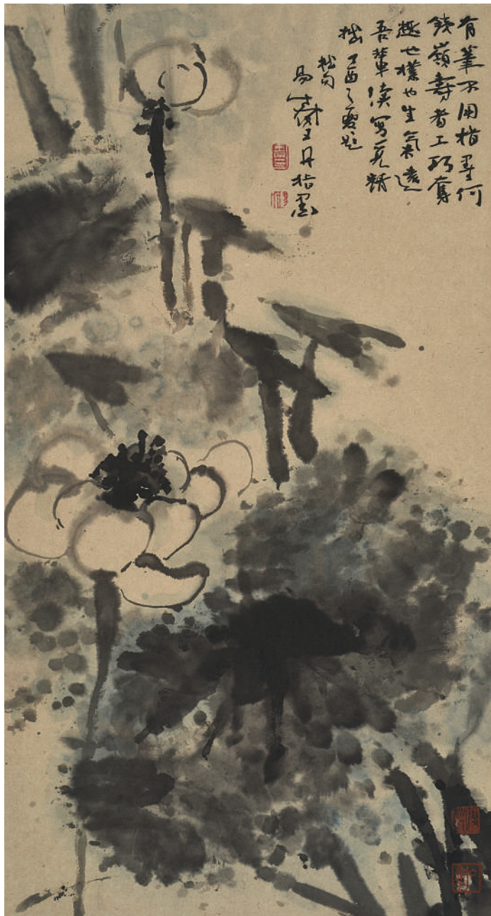
荷花图 (国画) 王丹 作