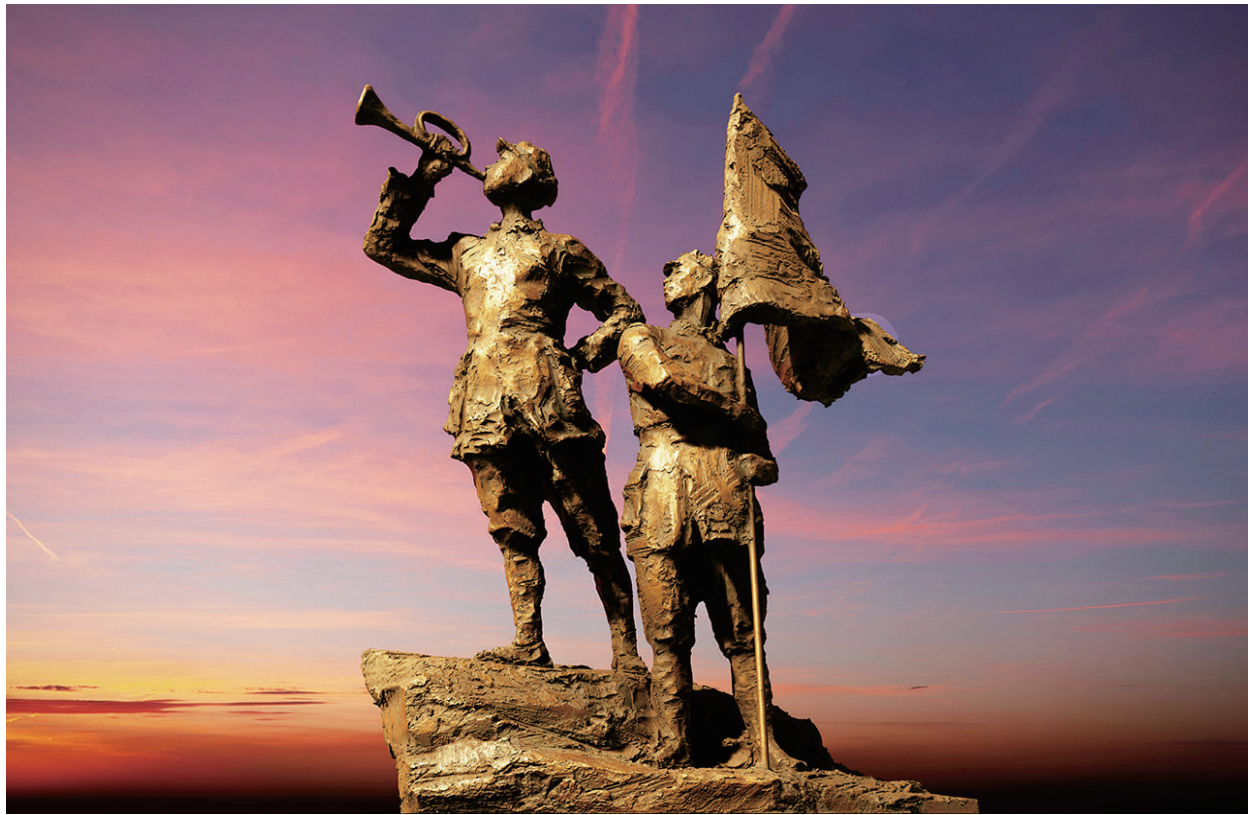
长征组雕·伟大远征 (雕塑)

新时代的号角已经吹响，书画界全国政协委员将和广大文艺工作者戮力同心、携手前行，肩负新使命，奋进新征程。