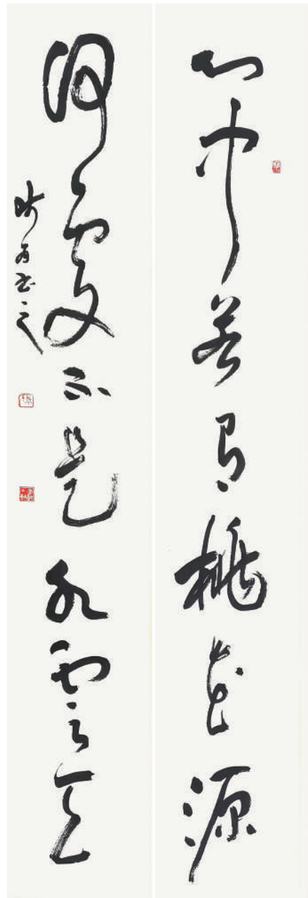
书法 景喜 作