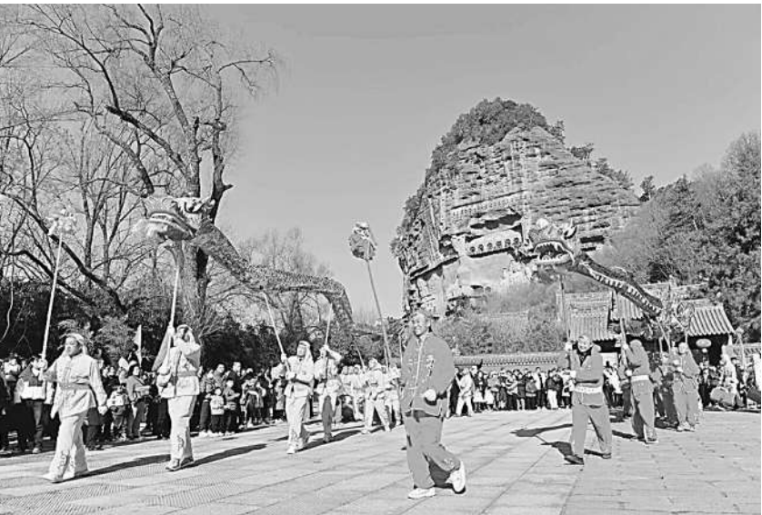
▲ 甘肃省天水市麦积山石窟