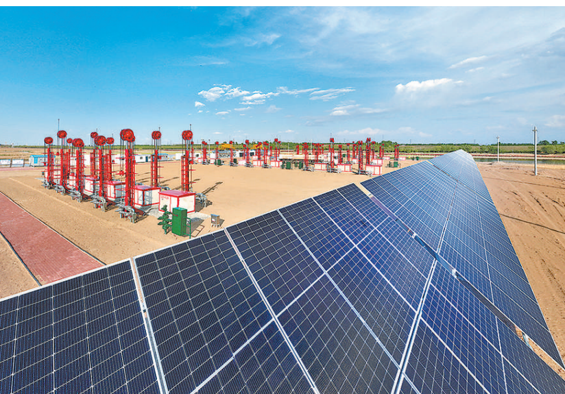
中国石油吉林油田亚洲最大陆地采油平台开启“绿电”生产模式

写下引领未来方面，中国石油瞄准更多前沿领域，加快布局培育新质生产力，形成并不断完善战略性新兴产业和未来产业布局，为推进中国式现代化提供持久动力。在青藏高原，中国石油首个百万千瓦新能源集中式并网发电项目——青海油田格尔木燃机重启及配套新能源项目正式开工，以绿色清洁低碳生产示范区建设助力守护“中华水塔”；在天山南麓，塔里木油田轮南储运中心，压差发电机组源源不断地将管线天然气压力势能转化为零碳电能，助力西气东输第一站成为零碳油气场站；在关中平原，宝石机械公司自主研发的绿色环保型钻机——全球首套5000米混合专用料H2464成为中国电力电缆导管行业唯一推荐的国产材料；独石化聚乙烯装置22线生产茂金属聚乙烯MHD3702产品获得成功，成为国内首家在冷凝状态下使用国产催化剂成功生产茂金属聚乙烯MHD3702产品的企业；广东石化炼化一体化项目全面投入商业运行，走出重质劣质原油深加工的特色路