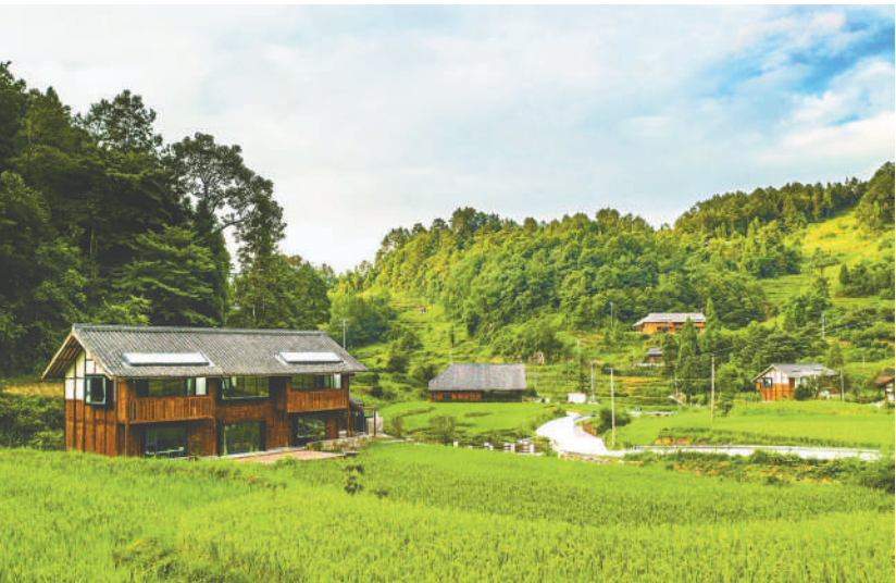
中国石油积极履行社会责任，接续助力乡村振兴，持续开展公益活动，支援抢险救灾，展现央企责任担当。图为中国石油在贵州习水县的乡村旅游帮扶示范项目——梧桐山民宿。