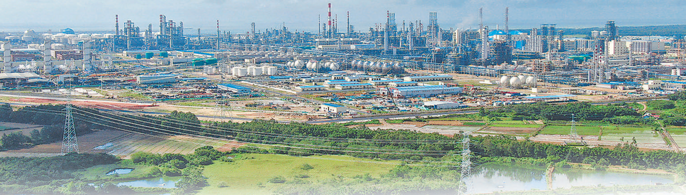
炼化一体化项目中国石油广东石化一次投产成功并投入商业运营。图为广东石化炼化一体化项目。