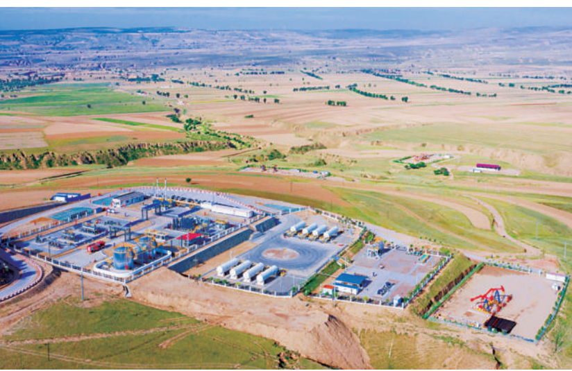
中国石油围绕国家碳达峰和油气保供要求，促进CCUS全产业链协同。图为全国规模最大、系统配套最全的二氧化碳驱油综合试验站——长庆油田采油五厂黄3区二氧化碳驱油综合试验站。