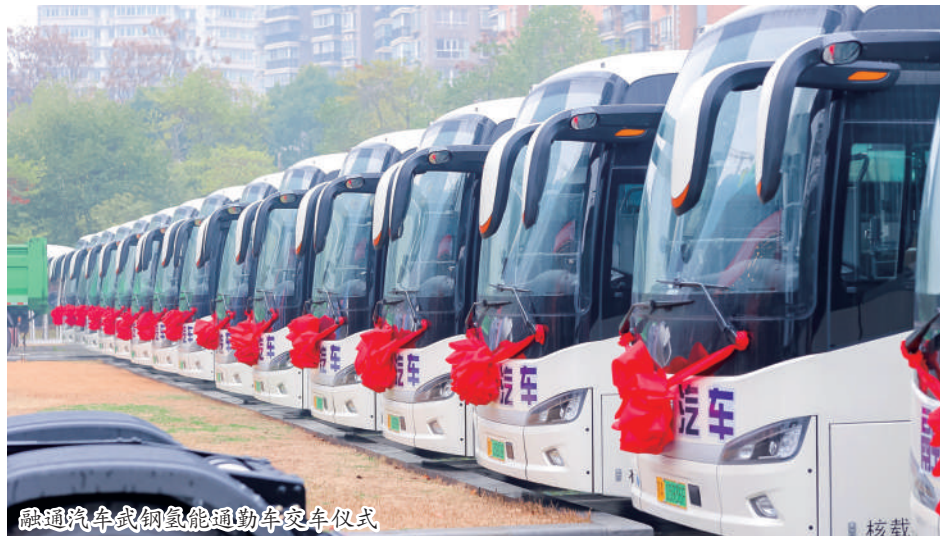
威通汽车武钢氢能通勤车交车仪式

青山区立足武汉，放眼全球，加快实施创新驱动发展战略，坚持规模化、集群化、高端化发展，以制氢为龙头，大力推动技术创新和场景示范应用，积极构建