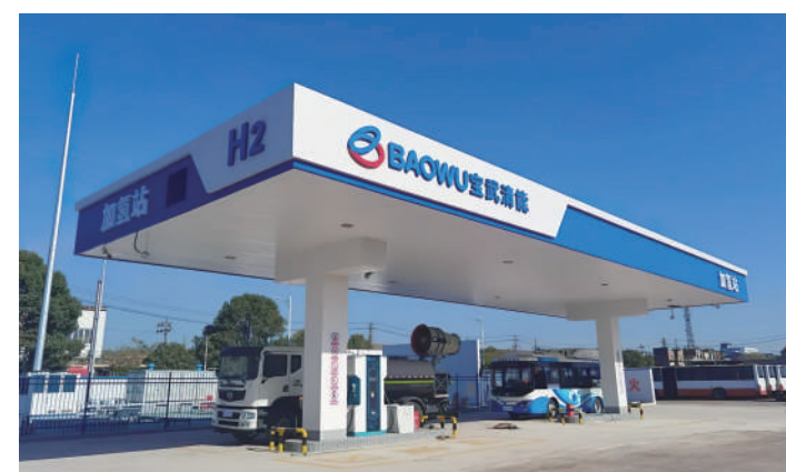
宝武清能白玉山加氢站