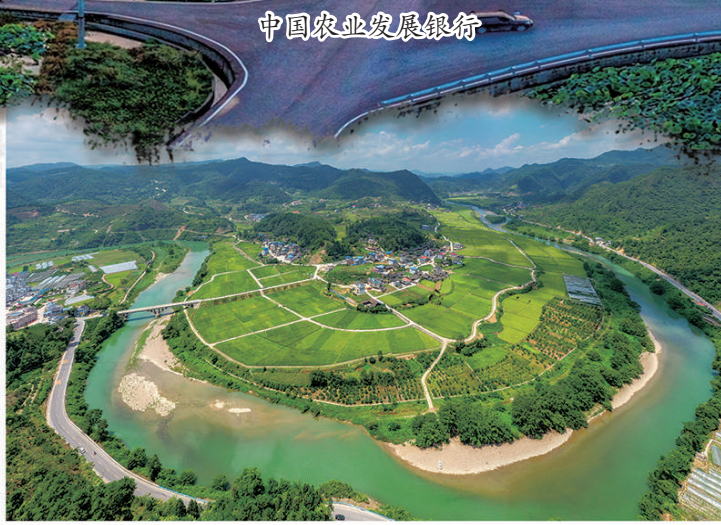
农发行贵州省黔东南州岑巩县支行支持的杂交水稻“育繁推”一体化项目