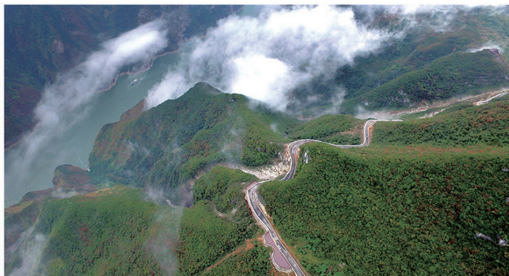
农发行重庆市分行支持的巫山农村公路项目

中国农业发展银行坚持以习近平新时代中国特色社会主义思想为指导，充分发挥政策性金融职能作用，持续推动党中央决策部署在全行落地落实，高质量发展和现代化建设迈出坚实步伐。2023年，累放贷款2.78万亿元，年末贷款余额8.79万亿元；政策性贷款占比94.12%，比年初提高0.91个百分点；资产总额10万亿元，取得历史性突破；不良贷款率0.45%，继续保持银行业金融机构较好水平，资产质量保持稳定，经营效益稳步提高。