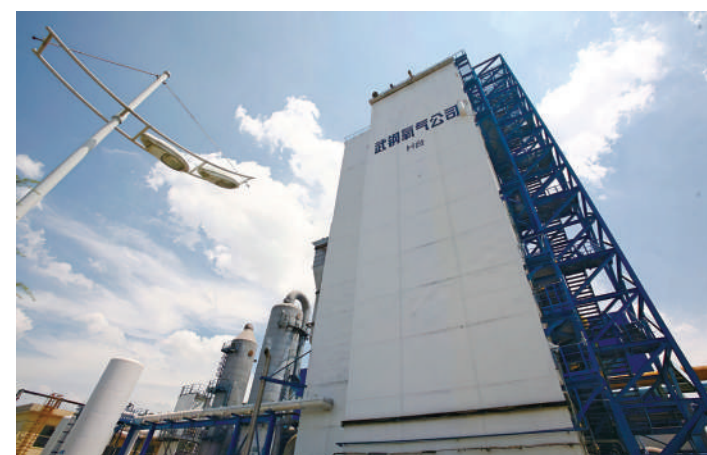
宝武清能武钢气体制氢生产线

北湖绿城氢能产业小镇在发展定位上，聚焦以氢能船舶为核心发展长江绿色航运打造区域示范标杆，以及推动周边龙头企业绿色转型低能升级发展两大核心功能特色，规划以氢能全产业链环节展示应用为核心，补齐“制储运加用”环节短板，打造研发和集成应用示范区，承担应用示范、研发生产及产业服务功能。产业体系上，计划建设以氢能综合展示应用及研发生产为特色产业核心，氢能服务码头项目为对外展示窗口，发展生活配套及商务配套的“2+2”产业体系。功能结构上，建设TOD发展模式下的“双轴双带、四芯一环”，其中“双轴”即创新驱动轴，往南对接武钢创新转型区、青山氢能三园，打通生产-研发-体验-展示的发展路径；沿江氢能发展轴，依托长江码头、工业港等交通优势条件，发展以氢能动力的绿色航运。“双带”即打通和平大道新兴产业创新轴与东侧氢能产业集群区的发展通道的聚能发展带和串联长江-村落-农田-湿地-湖泊的绿色生态产业带。“四芯”即氢能沿江发展芯、氢能创智服务芯、氢能未来芯、氢能产业科创芯。“一环”即将氢能集中展示单元有效串联，打造集氢能制造研发体验展示为一体的活力环线的氢能活力环。空间布局上，通过打造氢能示范区板块、生态农业板块两大板块，以及氢能创新中心（综合服务区）、绿城+氢能产业创新区、氢能未来社区、氢能生态农业区等四大片区，为青山区氢能产业发展提供要素支撑，实现高能级发展。