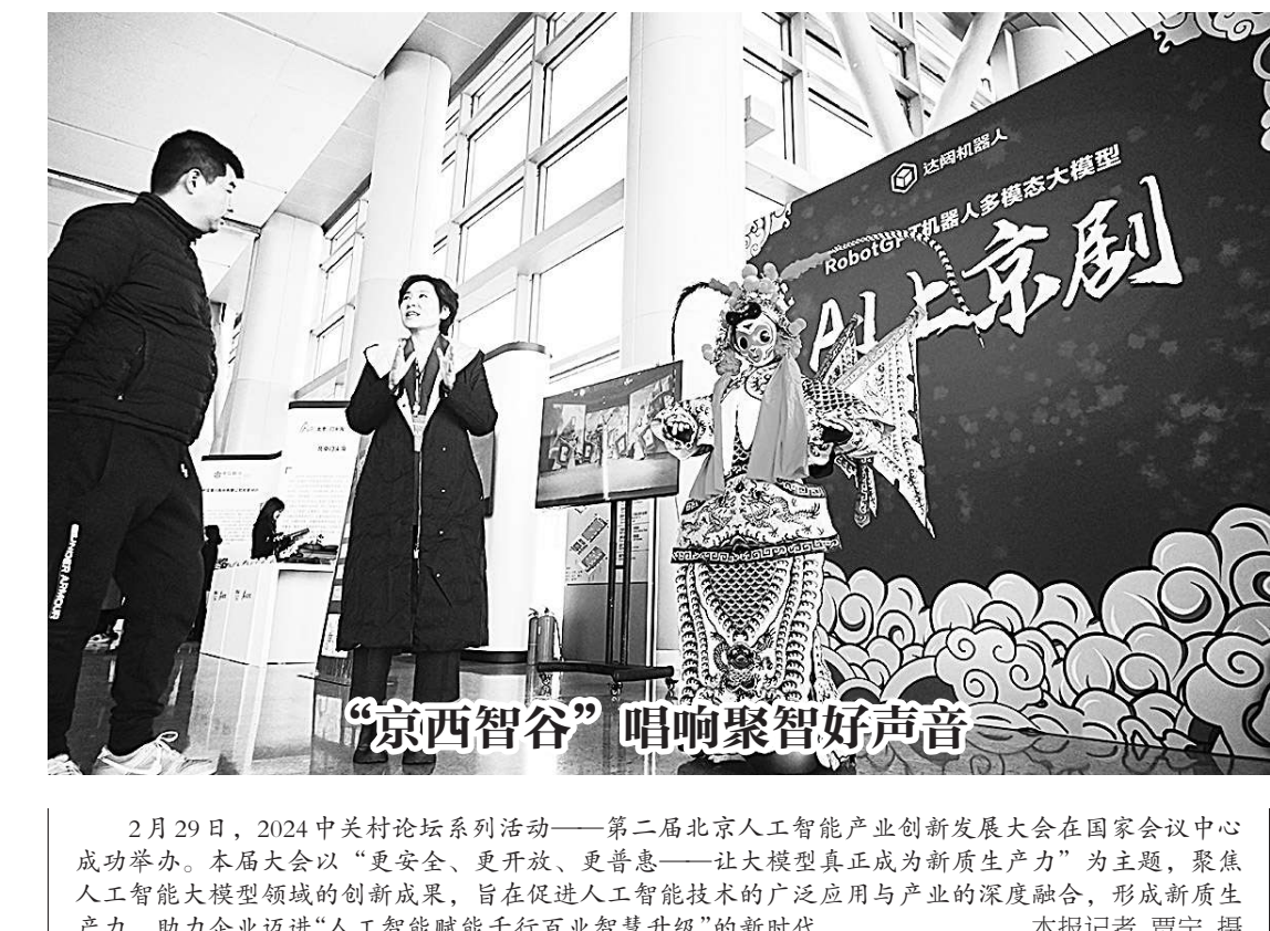
2月29日，2024中关村论坛系列活动——第二届北京人工智能产业创新发展大会在国家会议中心成功举办。本届大会以“更安全、更开放、更普惠——大模型真正成为新质生产力”为主题，聚焦人工智能大模型领域的创新成果，旨在促进人工智能技术的广泛应用与产业的深度融合，形成新质生产力，助力企业迈进“人工智能赋能千行百业智慧升级”的新时代。