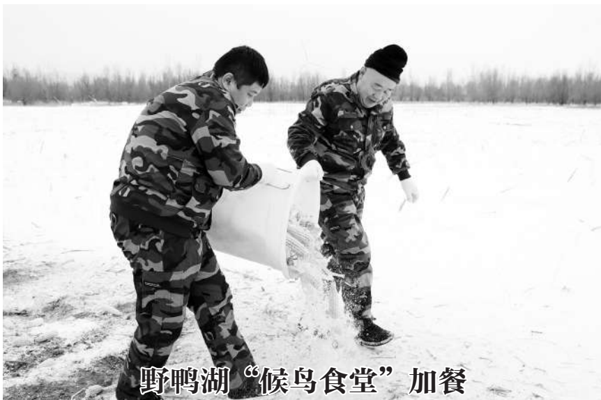
野鸭湖“候鸟食堂”加餐

致公党天津市委会提出,要加大对大气污染源的日常监管和执法力度,建立健全监测、检测体系,加强对排污企业的抽查和稽查,严肃查处违法排污行为。通过加强立法与管控,实现污染源的标本兼治,打好“十四五”蓝天保卫战。”