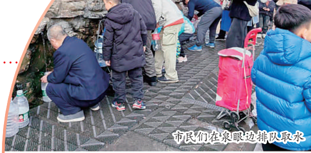
市民们在泉眼边排队取水

人间烟火气,最抚凡人心。熙熙攘攘的人群让“天下泉城,泉水人家”的理念更加厚重,也更具人间烟火。