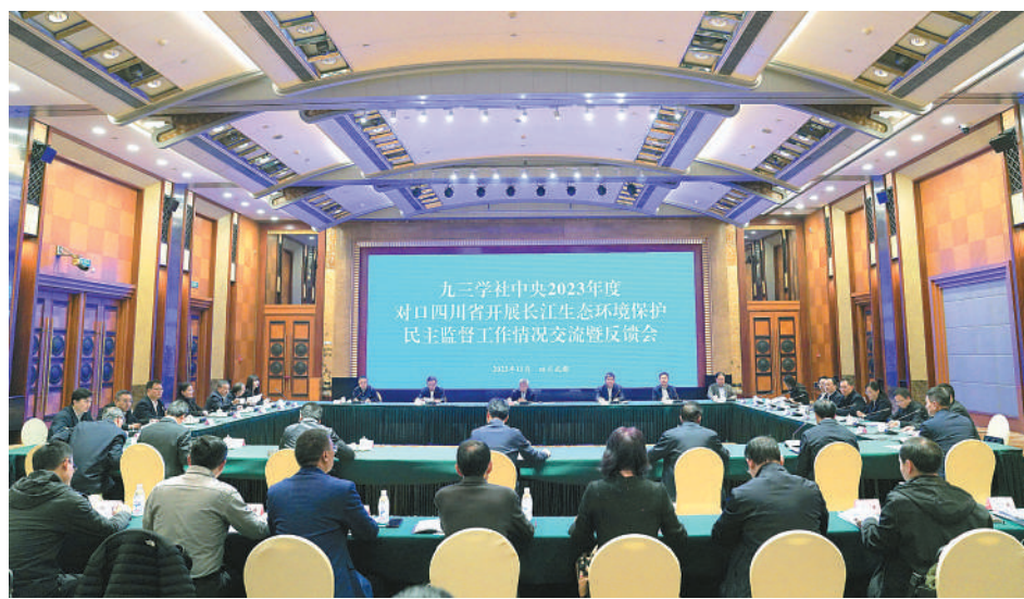
二〇二三年十一月，对口四川省开展长江生态环境保护民主监督工作情况交流暨反馈会议在四川成都召开。