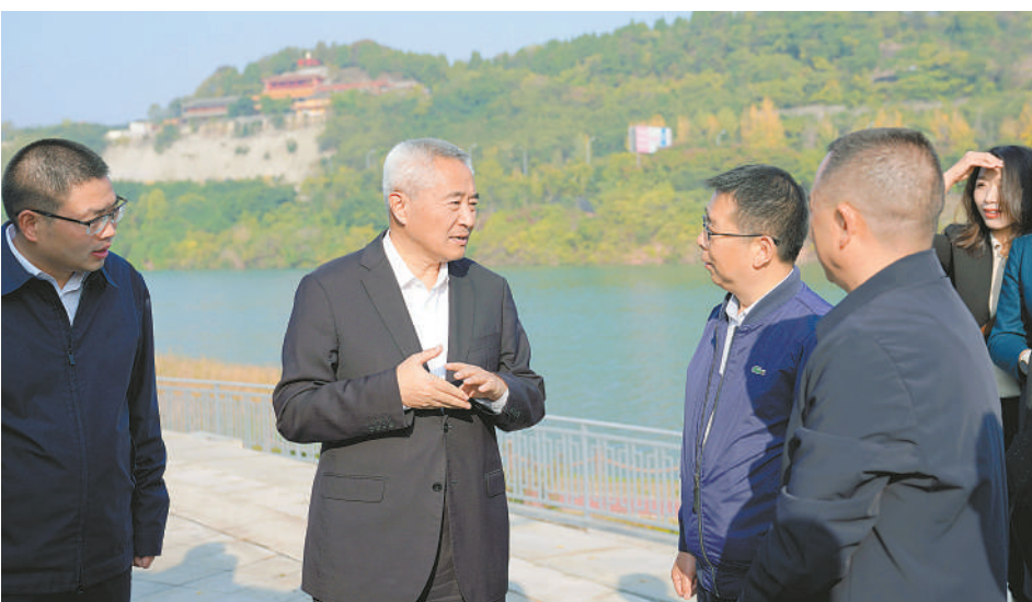
二〇二三年十一月，调研组一行到绵阳市桃花岛调研。