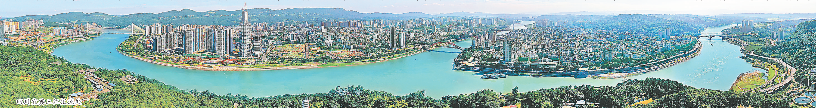
四川宜宾三江汇流处