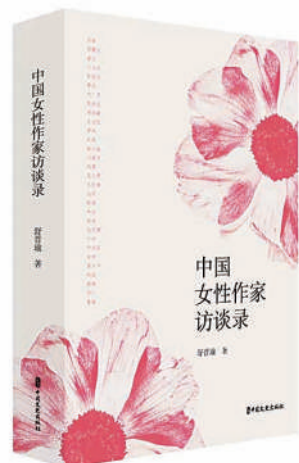
▲《中国女性作家访谈录》

在著名诗人、中国作协创作部主任向阳看来，舒晋瑜堪称是新世纪中国当代文学对话第一人，无论是她对话对象的范围，还是对话话题的延伸性，都值得关注。著名作家残雪认为，最好的作家访谈是创作和阅读的延伸，舒晋瑜的访谈是这方面的一个标杆。著名作家林白的感受则是：“舒晋瑜善且诚，专业和执着，会使