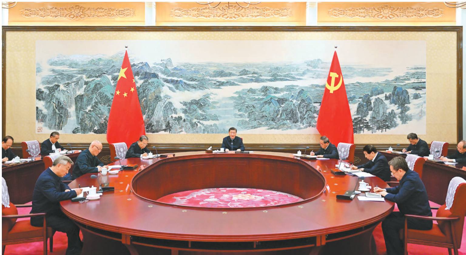
12月21日至22日,中共中央政治局召开学习贯彻习近平新时代中国特色社会主义思想主题教育专题民主生活会,中共中央总书记习近平主持会议并发表重要讲话。

新华社北京12月22日电 中共中央政治局于12月21日至22日召开学习贯彻习近平新时代中国特色社会主义思想主题教育专题民主生活会,聚焦学思想、强党性、重实践、建新功总要求,对照凝心铸魂筑牢根本、锤炼品格强化忠诚、实干担当促进发展、践行宗旨为民造福、廉洁奉公树立新风具体目标,按照以学铸魂、以学增智、以学正风、以学促干重要要求,联系中央政治局工作,联系带头旗帜鲜明讲政治、带头学懂弄通做实习近平新时代中国特色社会主义思想、带头贯彻党中央决策部署、带头践行宗旨为民造福、带头履行全面从严治党责任等方面的实际,总结成绩,查摆不足,进行党性分析,开展批评和自我批评。