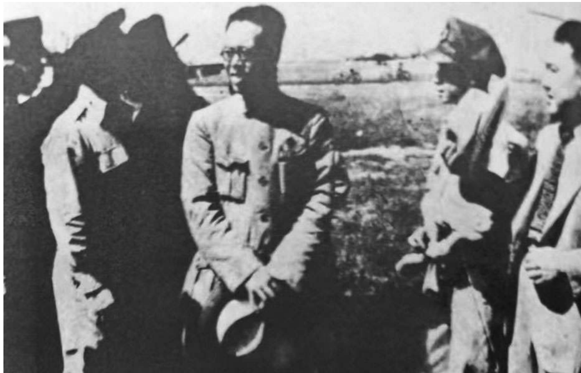
一九四六年六月，李立三到达沈阳，和国民党方面商讨遣返问题。