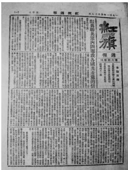
《红旗周报》第六期增刊