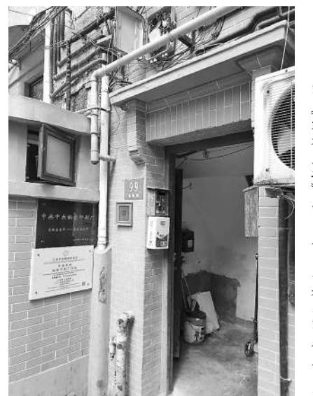
曾印《红旗周报》的中共中央秘密印刷厂旧址