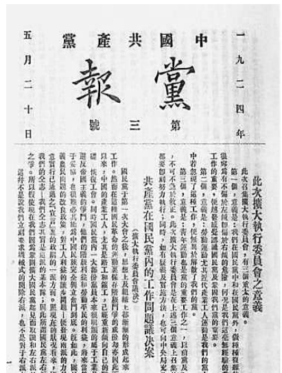
《中国共产党党报》第三号