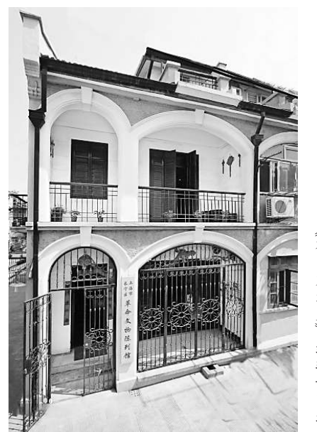
《布尔塞维克》编辑部旧址

在上海创办或出版的早期中共中央机关报刊中，有的敢为人先，有的策划精湛，有的编排考究，有的奋力开拓，它们坚持了鲜明的政治立场和办刊宗旨，也奠定了党报党刊的优良传统。（作者为第十二届上海市政协文史委委员）