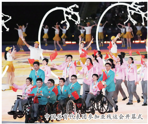
中国体育代表团参加亚残运会开幕式

从精彩赛场到美丽城市,处处都有志愿者忙碌的身影。亚残运会期间,6支城市侧残疾人志愿服务队伍也将提供手语翻译、信息咨询等服务。此外,220个杭州市级亚运文明驿站、314个区(县)级亚运文明驿站、3400余个新时代文明实践中心(所、站)串珠成链,成为新时代文明实践志愿服务的一道靓丽风景。