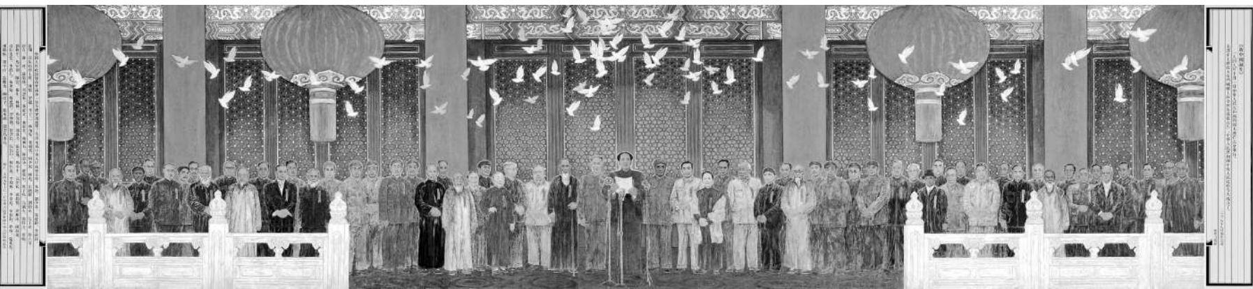
《新中国诞生》 2009年 中国美术馆藏

中国美术馆藏经典中国画《新中国诞生》是一件“国家重大历史题材美术创作工程”作品，气势恢宏、细节微妙，是重要的当代中国画精品力作。