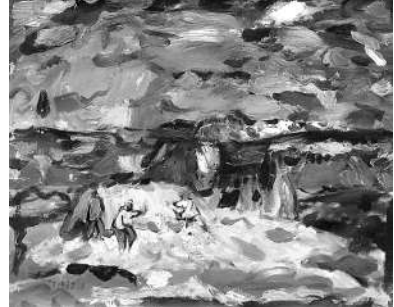
《打筱麦》（布面油画）67cm×80cm 1997年

土地、太行文化的性格，用艺术语言表现出来，真挚而纯粹。画面上看似随意的笔触和色彩，形成了既有绘画性，又有文学性的叙事风格，清新隽永，真诚、朴实、凝练又大气，具有很浓厚的中华文化精神和诗意特征。