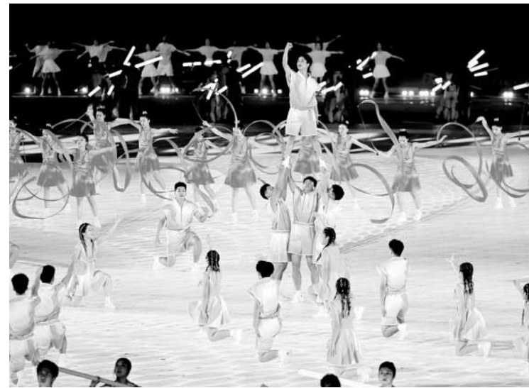
杭州第19届亚洲运动会开幕式文艺演出