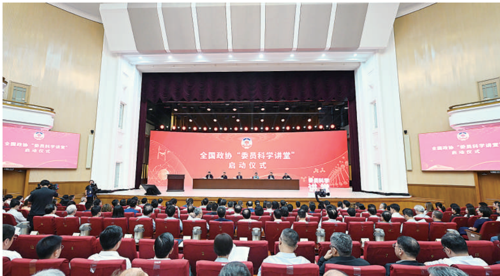
9月15日，全国政协“委员科学讲堂”首场讲座暨启动仪式在全国政协礼堂举行。