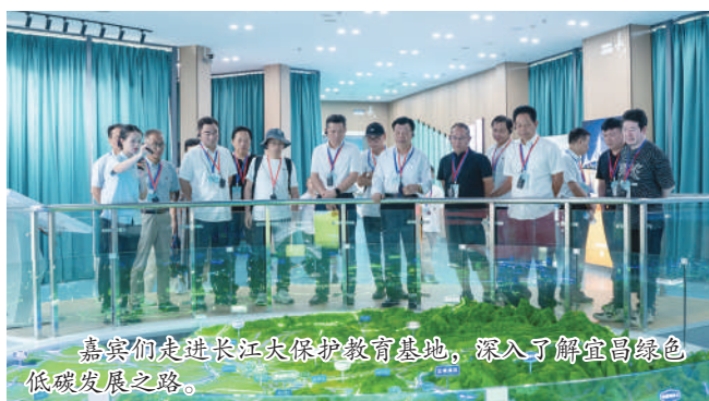
嘉宾们走进长江大保护教育基地，深入了解宜昌绿色低碳发展之路。