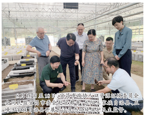
8月16日至18日，宜昌市政协人口资源环境委员会会同宜昌市委统战部、宜昌市生态环境局、宜昌市水利湖泊局、宜昌市农业农村局、宜昌市供销社等部门，赴宜昌市夷陵区开展黄柏河流域综合治理调研。