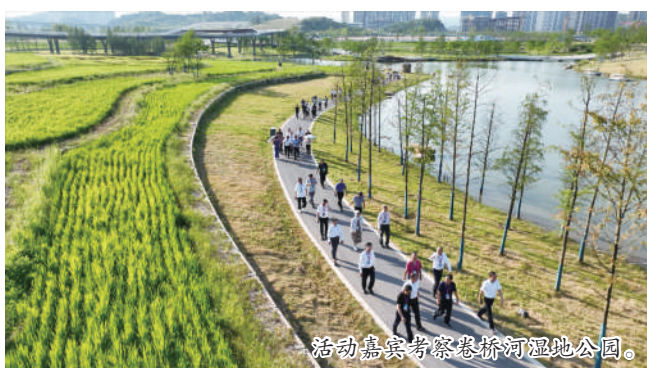
活动嘉宾考察卷桥河湿地公园。