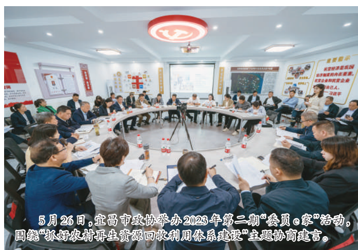
5月26日，宜昌市政协举办2023年第二期“委员e家”活动，围绕“抓好农村再生资源回收利用体系建设”主题协商建言。