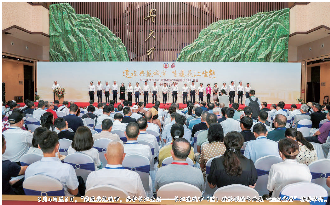
9月4日至5日，“建设典范城市，共护长江生态——长江流域市（区）政协联谊书画展·2023宜昌”活动举行。

“峡尽天开朝日出，山平水阔大城浮”——湖北宜昌是长江中游的起点，也是长江重要的生态屏障。