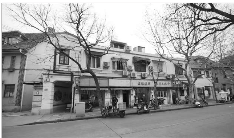
永嘉路371号-381号南国艺术学院旧址