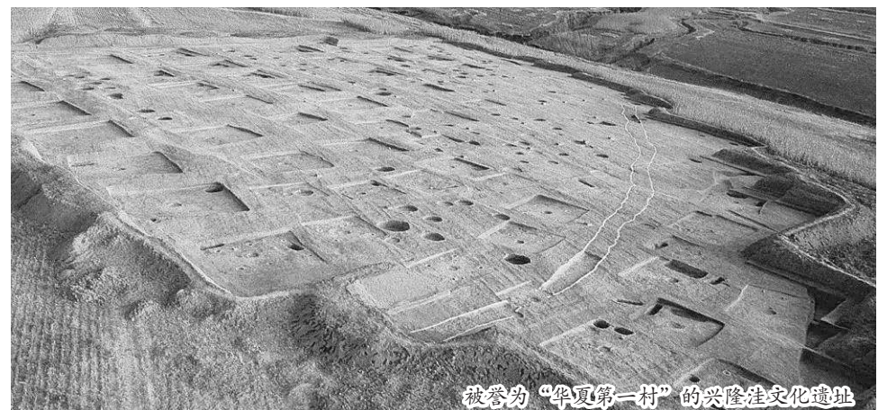
被誉为“华夏第一村”的兴隆沟文化遗址

中国社会科学院考古研究所党委书记张国春表示,敖汉旗史前考古学文化序列完整,是研究史前社会复杂化进程特别是文明起源、形成与早期发展的重要区域,实证了中华文明突出的连续性。2001年至2003年,中国社会科学院考古研究所内蒙古第一工作队对敖汉旗兴隆沟遗址第一地点进行了系统的考古发