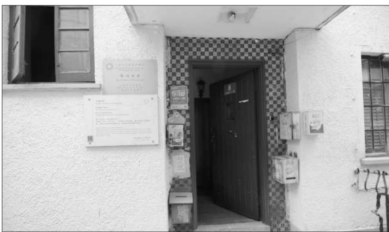
永嘉路321弄8号张澜旧居