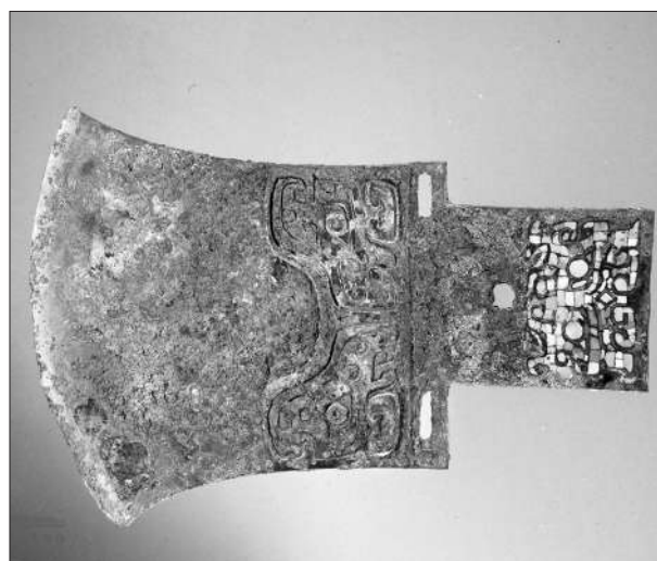
嵌绿松石钺 商代晚期 长25厘米 1959年入藏中国国家博物馆

此件嵌绿松石钺的器身及内部均有兽面纹,内部兽面纹由镶嵌工艺制作而成,内纹内嵌嵌绿松石为装饰。整件器物的装饰工艺精湛,色彩瑰丽。