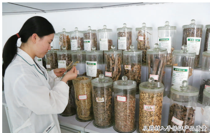
从药材入手把控产品质量

声，又积极展示了品牌底蕴，并将品牌文化、信念注入年轻人群心中，成为推进品牌年轻化战略，持续扩大品牌声量的有益尝试。