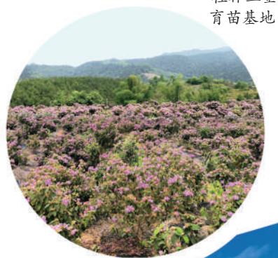
桂林三金育苗基地

目前，中医药全面振兴发展已成为国家战略。多年来对自主创新和知识产权保护探索的成效，进一步增强了桂林三金后续发展的底气和信心。未来可期，三金将秉承“创新驱动医药进步”的企业使命，坚持“稳中求进”总基调，持续推进中医药守正创新，推进数字化、智能化工厂升级，做强做优做大实体经济，为中医药产业高质量发展、为健康中国建设始终砥砺前行！