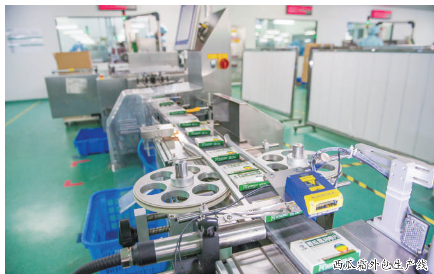
西瓜霜外包生产线