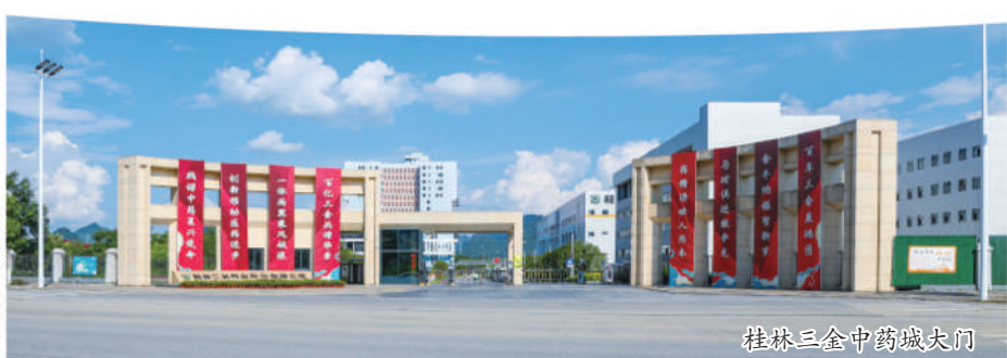
桂林三金中药城大门