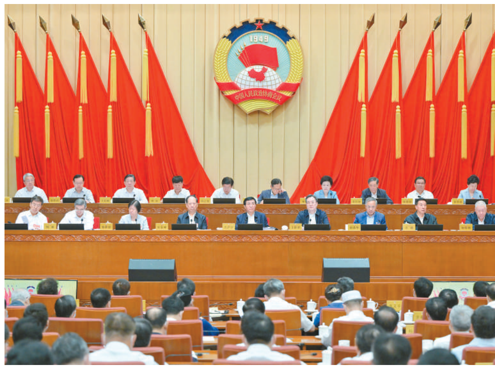
8月22日上午，政协第十四届全国委员会常务委员会第三次会议在北京开幕。中共中央政治局常委、全国政协主席王沪宁主持开幕会。中共中央政治局常委、国务院副总理丁薛祥应邀出席会议并作报告。