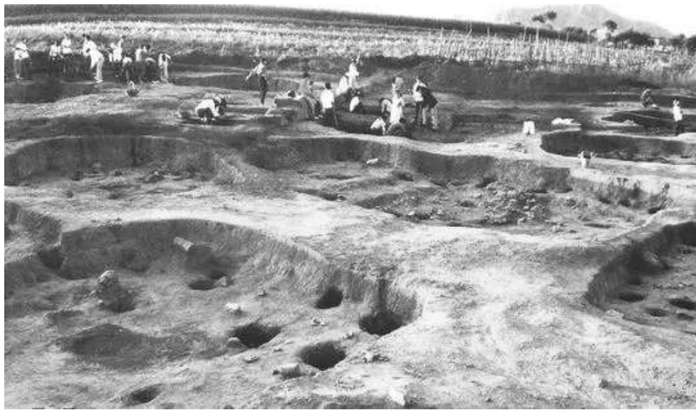
1993年查海遗址发掘现场

在中国考古学迈向第二个百年进程的大时代背景下,如何充分运用中华优秀传统文化的宝贵资源,进一步做好查海遗址群今后的考古发掘研究、文化内涵阐释和保护利用?如何拓宽研究时空范围和覆盖领域,进一步回答好中华文明起源、形成、发展的基本途径、内在机制以及各区域文明演进路径等重大问题,以把中国文明历史研究引向深入,增强历史自觉、坚定文化自信?本报记者采访相关专家学者。