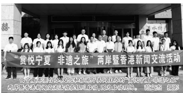
由宁夏港台办、文化和旅游厅共同主办的“赏悦宁夏·非遗之旅”两岸暨香港新闻交流活动在银川启动,图为启动仪式。

据了解,此次活动以“推动两岸共同弘扬中华文化,促进两岸同胞心灵契合”为目的,以非遗文化搭建交流平台,用镜头记录宁夏非遗文化魅力,旨在促进两岸青年同胞心灵契合,用心用情传播传统文化,绘声绘色讲好宁夏故事。