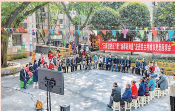
九龙坡区政协召开“三师进社区”暨“渝事好商量”走进民主村城市更新院坝会