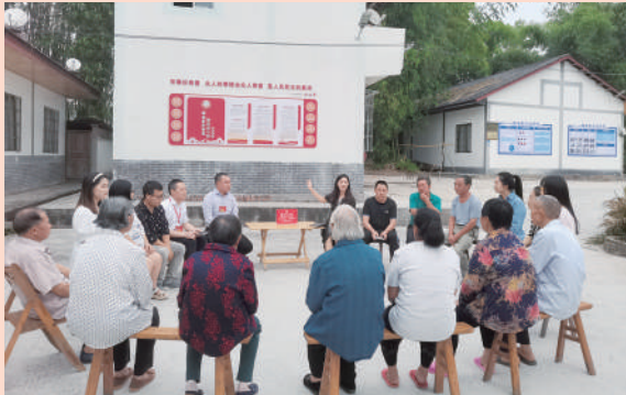
荣昌区政协委员到万灵镇唐家院子就瀾溪河流域生态环境保护开展小院协商