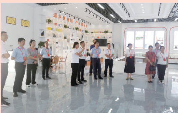
奉节县政协开展“百名委员访百企”视察活动

盛夏时节，市民发现桃花溪“协商文化长廊”增添了主题小品，更新了风雨长廊，协商文化气息更加浓郁。这是九龙坡区政协作为重庆市首批“渝事好商量”平台建设试点区县深度打造“渝事好商量”协商平台的一个缩影。