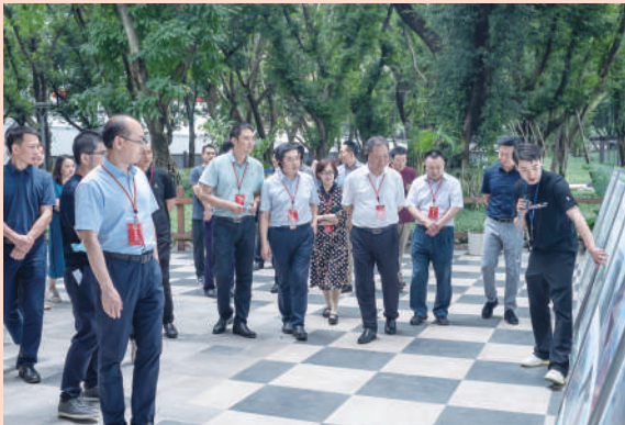
渝中区政协常委会围绕长滨公园建设情况开展监督性视察

“从不同侧面、不同层次、不同深度进行立体式监督，从议题生成、协商解题到监督整改落实形成‘履职链条’，是我们创新发展民主监督的生动体现。”区政协负责人表示，将推动政协民主监督工作持续向好、提质增效，为党委、政府科学决策提供参考。