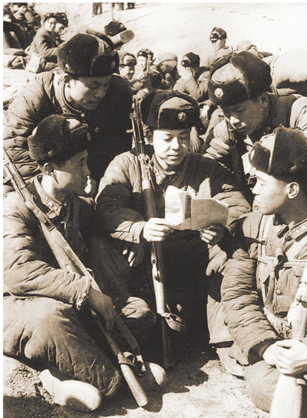
▲战友听雷锋讲学习《毛著》的体会