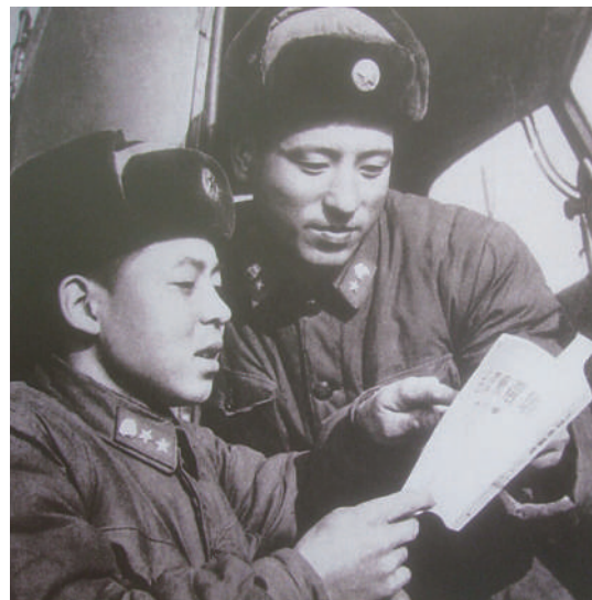
▲雷锋辅导战友乔安山学习《毛泽东选集》

韩万金又拿起雷锋的自述材料翻阅着——“解放后我有了家,我的母亲就是党”。这14个字说明了什么?这份材料不就是雷锋的入党申请书吗?