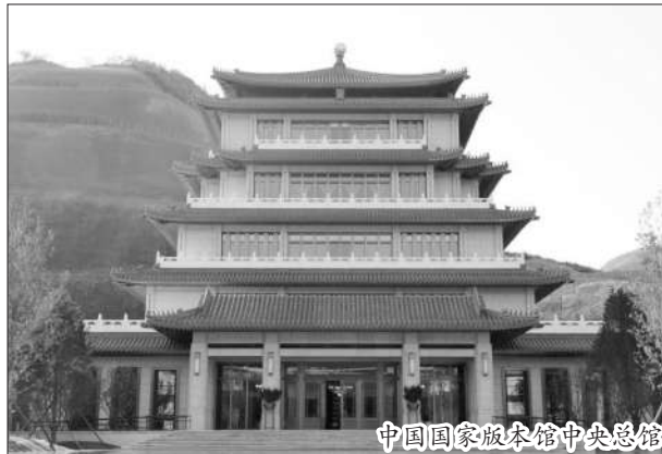
中国国家版本馆中央总馆