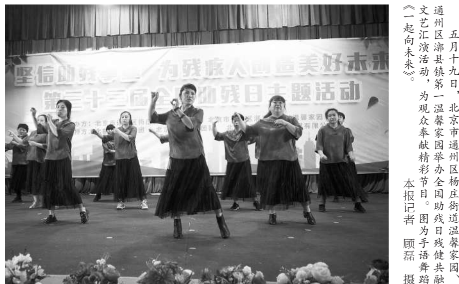
五月十九日,北京市通州区潞县镇第一温馨家园举办全国助残日主题文艺汇演活动,为观众奉献精彩节目。图为手语舞蹈《一起向未来》。