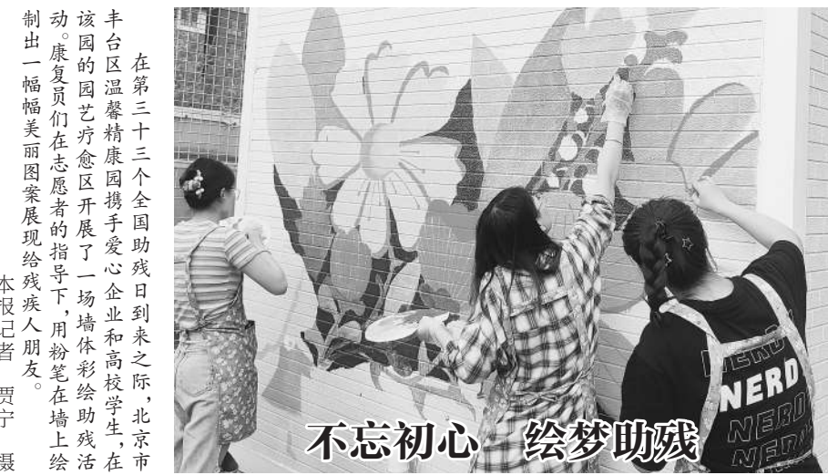
在第三十三个全国助残日到来之际,北京市丰台区温馨家园携手爱心企业和高校学生,在该园的园艺疗愈区开展了一场墙体彩绘助残活动。康复员们在志愿者的指导下,用粉笔在墙上绘制出一幅幅美丽图案,展现给残疾人朋友。

我希望残疾人群体能得到更加普遍的关注,人人公益、全民公益的理念更加深入人心。同时,希望党和国家出台更多政策,健全助残公益的相关体制,促进规范化发展,让管理更加人性化,让捐赠更加便利,受助者的个性化需求得到满足。