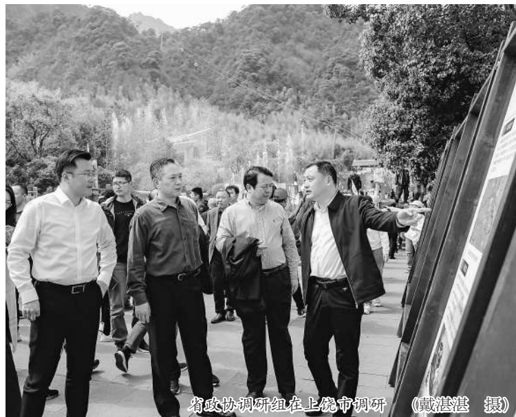
省政协调研组在上海调研