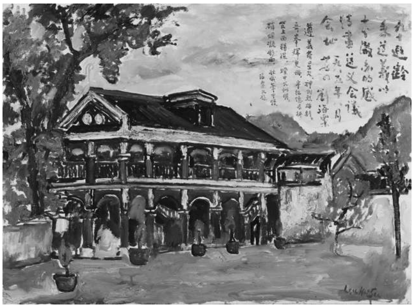
《遵义会议会址》麻布油画 1985年 81厘米×110厘米 中国美术馆藏 刘海粟 作

2023年,是中国美术馆建馆60周年、《人民政协报》创刊40周年。本刊特别推出“同心协力写丹青——中国美术馆藏书画界全国政协委员美术作品选粹”系列文章,以绘读者。