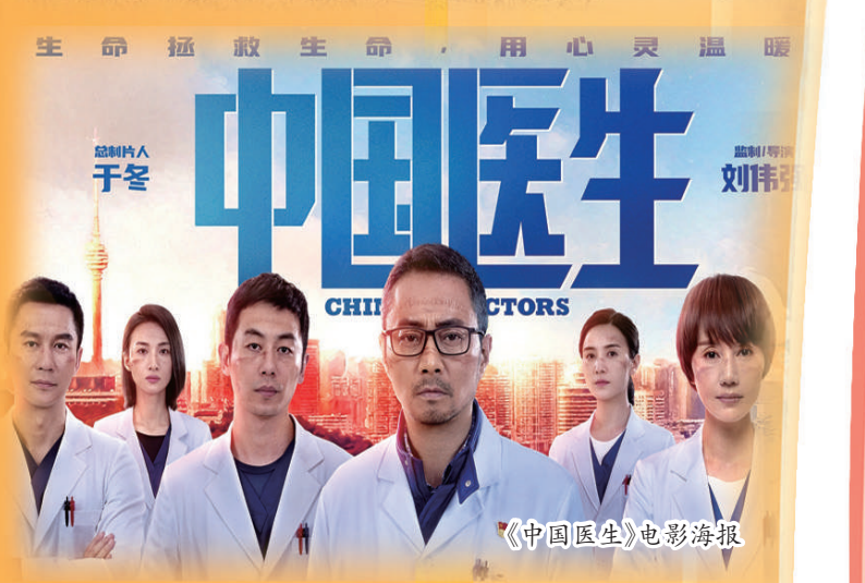
《中国医生》电影海报