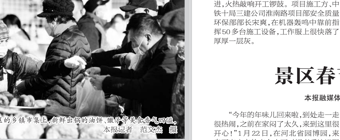
春节期间,在宁夏回族自治区的多镇市集上,新鲜出炉的油炸、徽子等美食香气四溢,吸引人们纷纷前来购买。