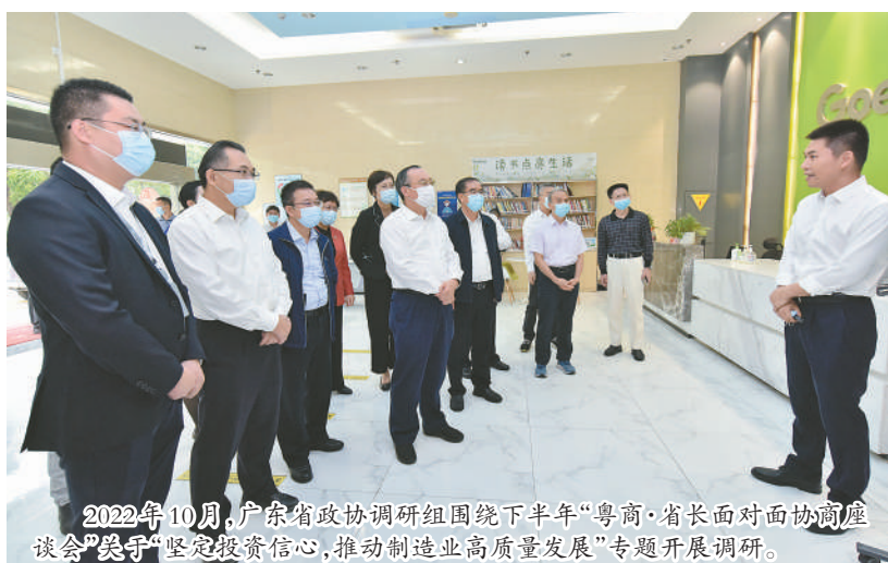
2022年10月,广东省政协调研组围绕下半年“粤商·省长面对面协商座谈会”筑牢“坚定投资信心,推动制造业高质量发展”专题开展调研。

围绕同一个问题“较劲”的例子在广东省政协不胜枚举,包括农房管控和风貌提升、推进“双碳”工作落实、居民饮用水安全、养老服务、家政服务……都在持续跟进中,不断形成合力,逐步推动解决。