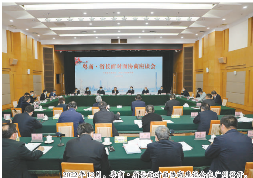
2022年12月,粤商·省长面对面协商座谈会在广州召开。

切口小、关联广、讲真话。不仅议题灵活,协商的形式也是灵活多变,委员们进社区、进农村、进学校、进企业实地协商,利用问卷、网络等各种手段,打破会议室里正襟危坐的“念稿式”协商,进一步释放了协商的效能。