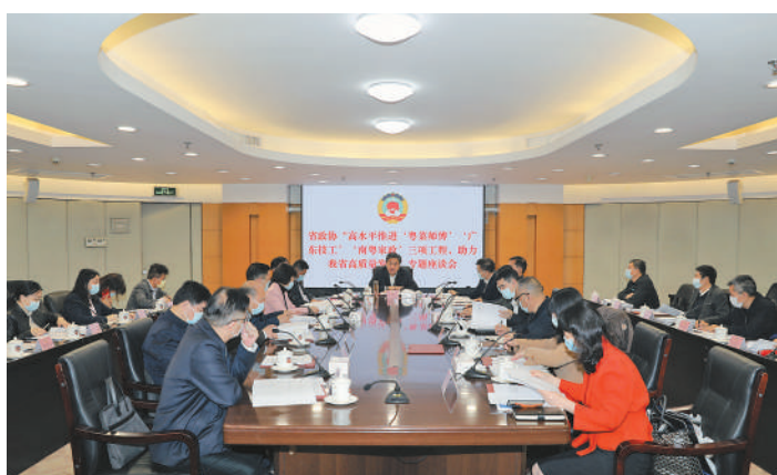
2022年3月,广东省政协召开“高水平推进‘粤菜师傅’‘广东技工’‘南粤家政’三项工程,助力我省高质量发展”专题座谈会。

协商主体参与面广、协商选题精准灵活、协商调研广泛深入、协商形式丰富多样,如此便是“广东政协协商”精品频出的秘诀所在。