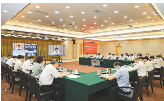
2022年9月,广东省政协召开远程专题协商会,围绕“加快发展县域经济,助力乡村振兴”协商议政。