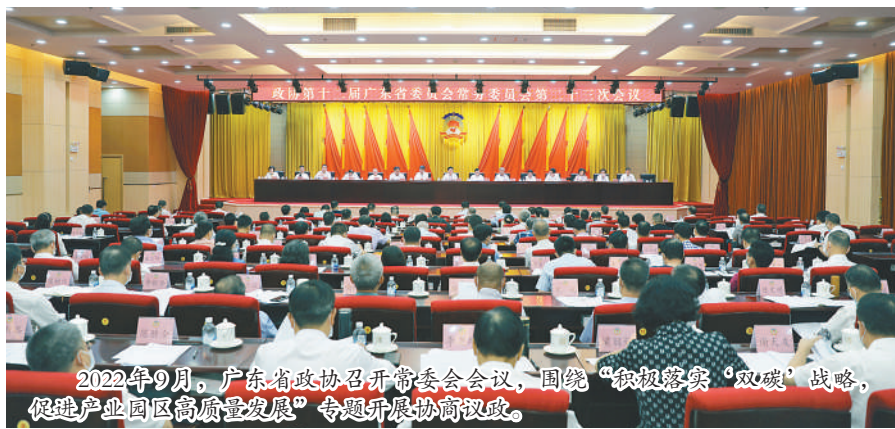
2022年9月,广东省政协召开常委会会议,围绕“积极落实‘双碳’战略,促进产业园区高质量发展”专题开展协商议政。

从一年举办一次,到每年举办两次,并作为一项制度性安排被固定下来,再到印发《粤商·省长面对面协商座谈会工作规则》,从制度规则层面面对这一机制的常态化运行加以规范。通过不断地创新,使得“摸着石头过河”的一种探索最终变成了广东政协协商民主的“金字招牌”。而这个畅通、有效、广泛的协商渠道,正全力保障广东经济健康持续发展。