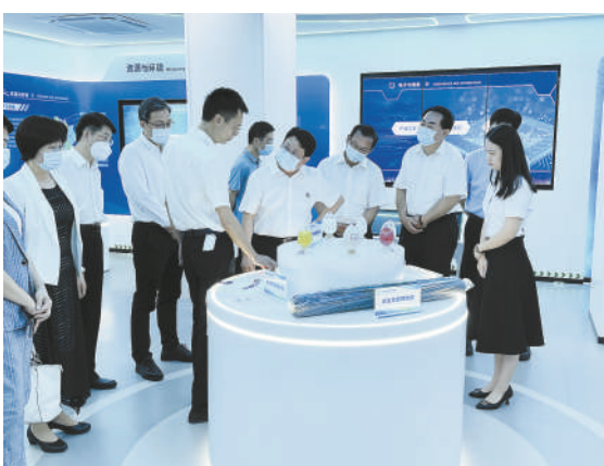
2022年7月,广东省政协调研组围绕“创新科技体制机制,以科技赋权激励和推动科技成果转化”开展专题调研。