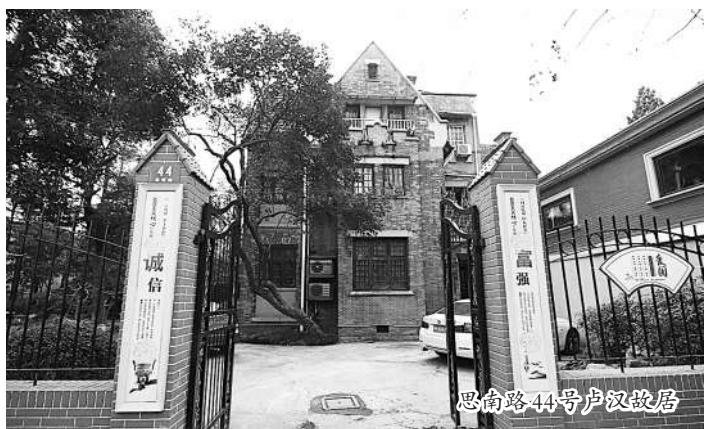
思南路44号：卢汉故居