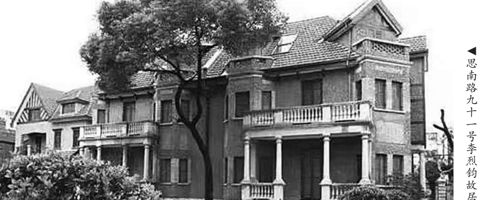
思南路九十一号李烈钧故居