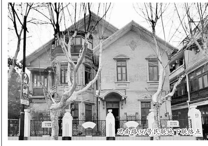
思南路91号：民联地下联络点