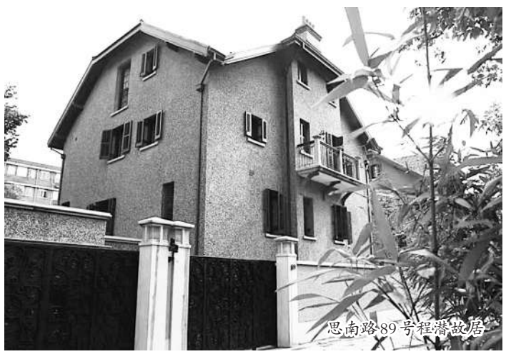
思南路89号：程潜故居

1927年底，程潜在国民党内的政治斗争中失败，寓居上海，居住于思南路89号，常借诗词发泄，消磨岁月。