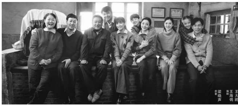
▲由梁晓声的长篇小说《人世间》改编成电视剧《人世间》，此为电视剧海报。

恋；因好友牺牲承诺照顾其恋人，但女方却另嫁；因好友恋人离婚后，二哥将其娶为妻子，得以实现对战友的承诺；因妻子不幸遭遇车祸，二哥又成了单身，不管遭际有多坎坷，二哥始终不改初心。也许多多挫折与不幸全都集中在一个人身上似乎太过巧合，但二哥心中永不放弃的英雄情结及其可爱的执着与倔强，读后令人肃然起敬。概括而论，上述优秀的小说创作，既描写反映了中华民族由站起来到富起来再到强起来的伟大历史跨越，生动刻画了筋骨坚韧、血肉饱满、个性鲜明的人物形象，又深刻诠释了民族精神图景的深厚文化价值与意义，真实再现了华夏儿女或大仁大爱、大忠大勇、大节大义，或朴素平实、热爱生活、努力工作、善待他人的至纯至真至善的人性，将创作主体的独立思考与感受与时代的需求、人民的呼唤和整个时代的发展律动有机联通为一体。