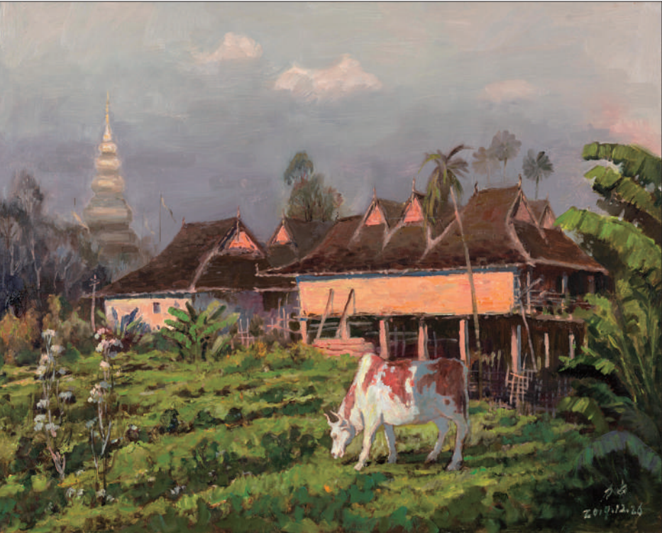
西双版纳的田野(油画)

主旋律，增强中华民族自豪感，推进文化自信自强，至今已连续举办三届。第三届“香凝如故”全国美术作品展览自征稿以来共收到中国画和油画作品4575件，最终评出入选作品86件，展览还增加了特邀和借展作品，共展出作品90余件。参展作品主题鲜明，形式新颖，内容丰富，通过描绘祖国建设、山河新貌、人民幸福生活的时代场景，热情讴歌了中国共产党领导全国各族人民取得的辉煌成就以及为实现中华民族伟大复兴的中国梦作出的伟大贡献。