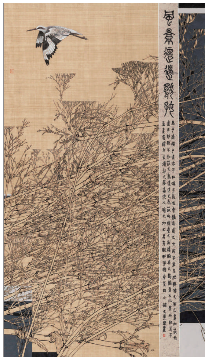
风景这边独好(国画)