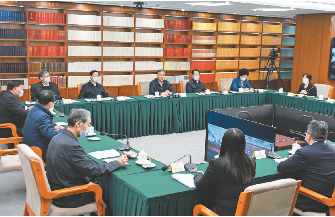
十一月二十四日,全国政协委员读书群学习宣传贯彻中共二十大精神交流会在北京召开。全国政协主席汪洋出席并讲话。

本报讯(记者 吕巍)全国政协委员读书群学习宣传贯彻中共二十大精神交流会24日在京召开,全国政协主席汪洋出席会议并讲话。