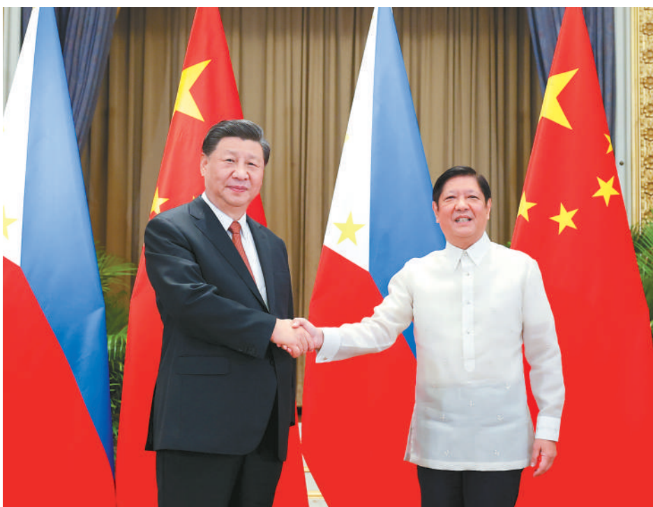
当地时间11月17日下午，国家主席习近平在泰国曼谷会见菲律宾总统马科斯。

新华社曼谷11月17日电（记者 耿学鹏 毛鹏飞）当地时间11月17日下午，国家主席习近平在泰国曼谷会见菲律宾总统马科斯。