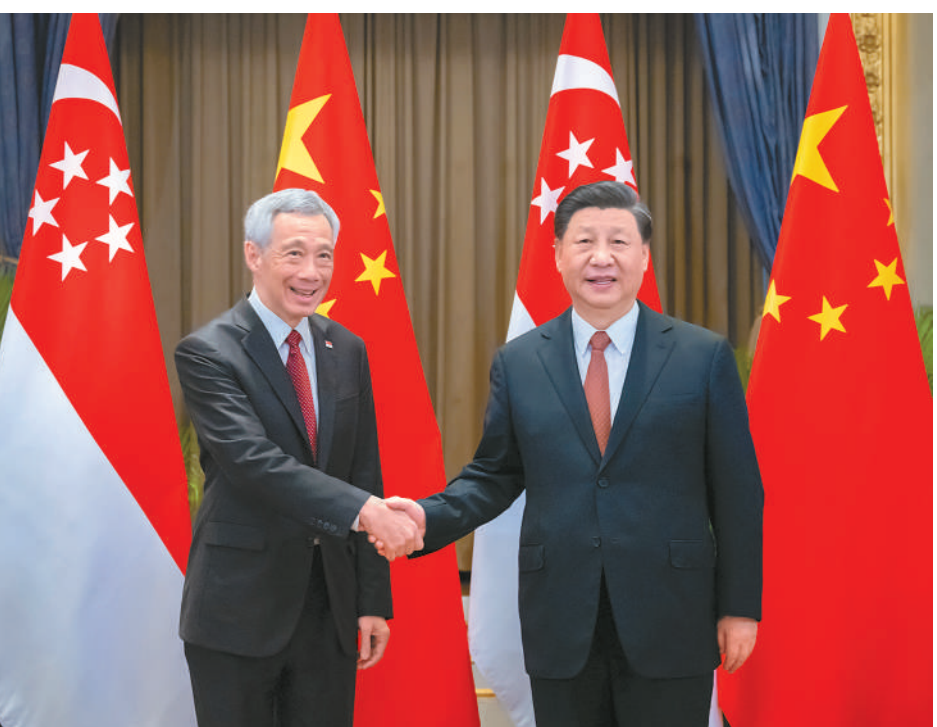
当地时间11月17日下午，国家主席习近平在泰国曼谷会见新加坡总理李显龙。