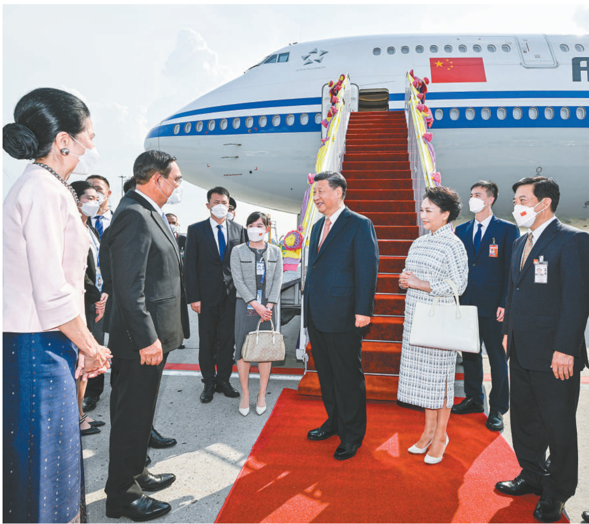
当地时间十一月十七日下午，国家主席习近平乘专机抵达泰国曼谷，出席亚太经合组织第二十九次领导人非正式会议并对泰国进行访问。这是习近平和夫人彭丽媛乘坐的专机抵达曼谷素万那普国际机场时，泰国总理巴育夫妇、副总理兼外长敦夫、文化部部长伊提蓬夫妇等热情迎接。