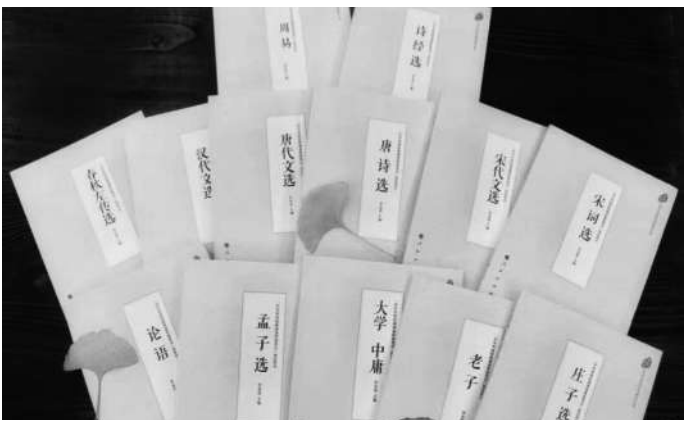
《中华传统经典诵读文本》