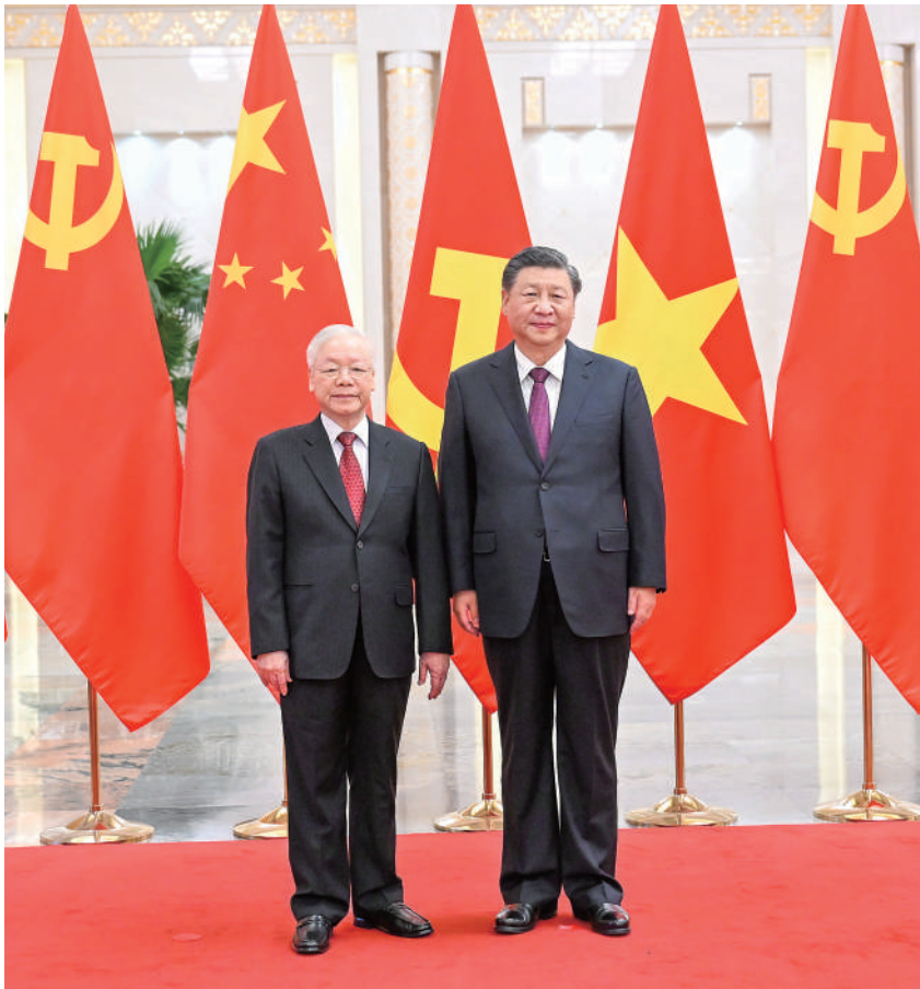
10月31日，中共中央总书记、国家主席习近平在北京人民大会堂同越共中央总书记阮富仲举行会谈。这是会谈前，习近平在人民大会堂北大厅为阮富仲举行欢迎仪式。