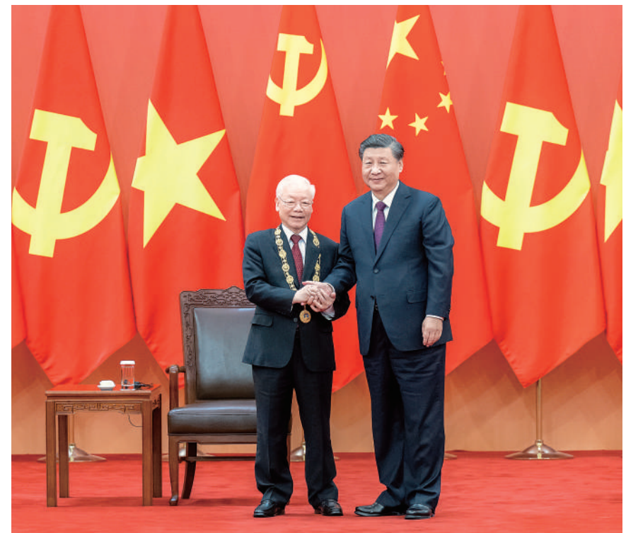
10月31日，中共中央总书记、国家主席习近平在北京人民大会堂向越共中央总书记阮富仲授予中华人民共和国“友谊勋章”，并举行隆重颁授仪式。

习近平指出，中越是山水相连、唇齿相依的好邻居、好朋友，是志同道合、命运与共的好同志、好伙伴，是致力于人类和平与进步事业的命运共同体。在两国推进社会主义现代化