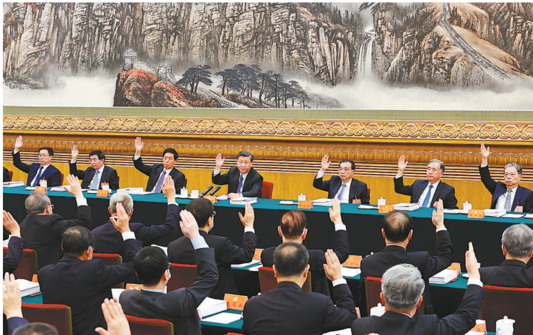
10月21日,中国共产党第二十次全国代表大会主席团在北京人民大会堂举行第三次会议。习近平、李克强、栗战书、汪洋、王沪宁、赵乐际、韩正等出席会议。

新华社北京10月21日电 中国共产党第二十次全国代表大会主席团21日上午在人民大会堂举行第三次会议,通过二十届中央委员会委员、候补委员和中央纪委委员候选人名单(草案),提交各代表团酝酿。 习近平同志主持会议。 会议通过了经各代表团差额预选产生的二十届中央委员会委员、候补委员和中央纪委委员候选人名单(草案),决定将名单提交各代表团酝酿。