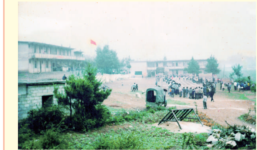
2009年的五里岗中学学生参加田径比赛情景