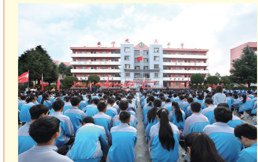
2021年9月18日威宁县九三中学学生参加励志教育报告会时的情景